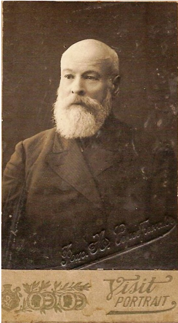
Іван Миколайович Михайловський в останні роки життя