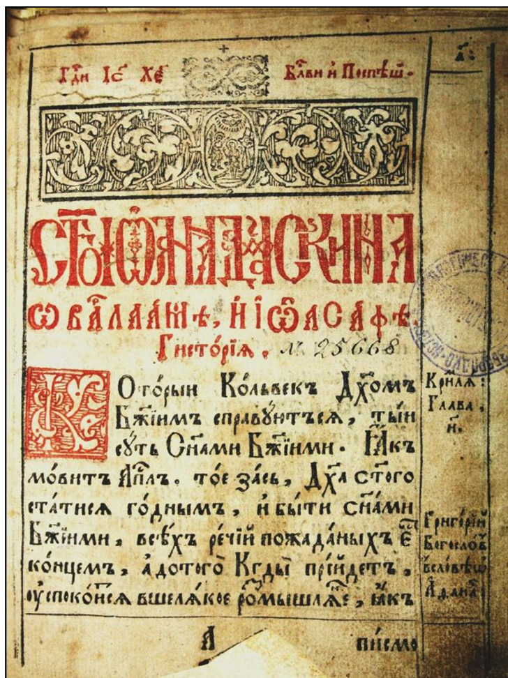
Іоанн Дамаскін. Повість про Варлаама та Йоасафа. Кутеїн, 1637.