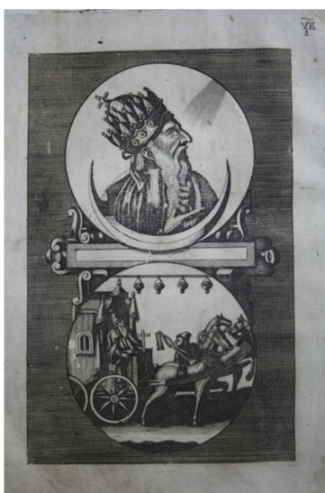
Лопатинський Ф. Обличеніе неправды раскольнической. СПб.: Синодальна друкарня, 1745