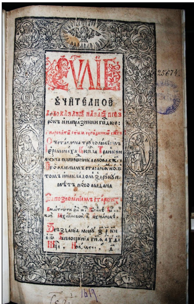
К. Транквіліон-Ставровецкий. Євангеліє учительне. Могилів, друк М.Вощанки, 1697.