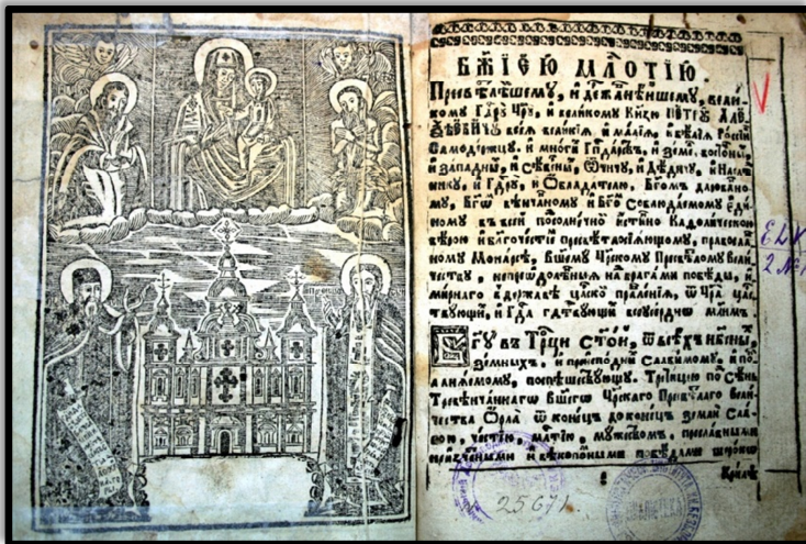
Максимович І. Феатрон нравовчителный. Чернігів, 1707