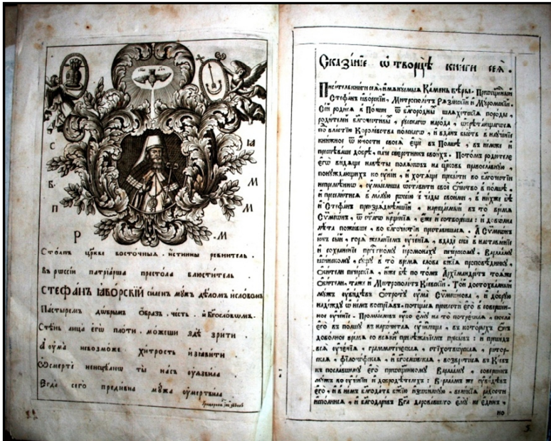
Яворський С. Камінь православної віри. Москва: Синодальна друкарня, 1728