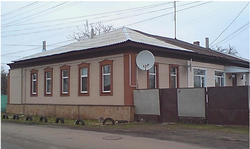
Будинок І.М.Михайловського в Ніжині (сучасне фото, вул. М.Кропив'янського, 7)