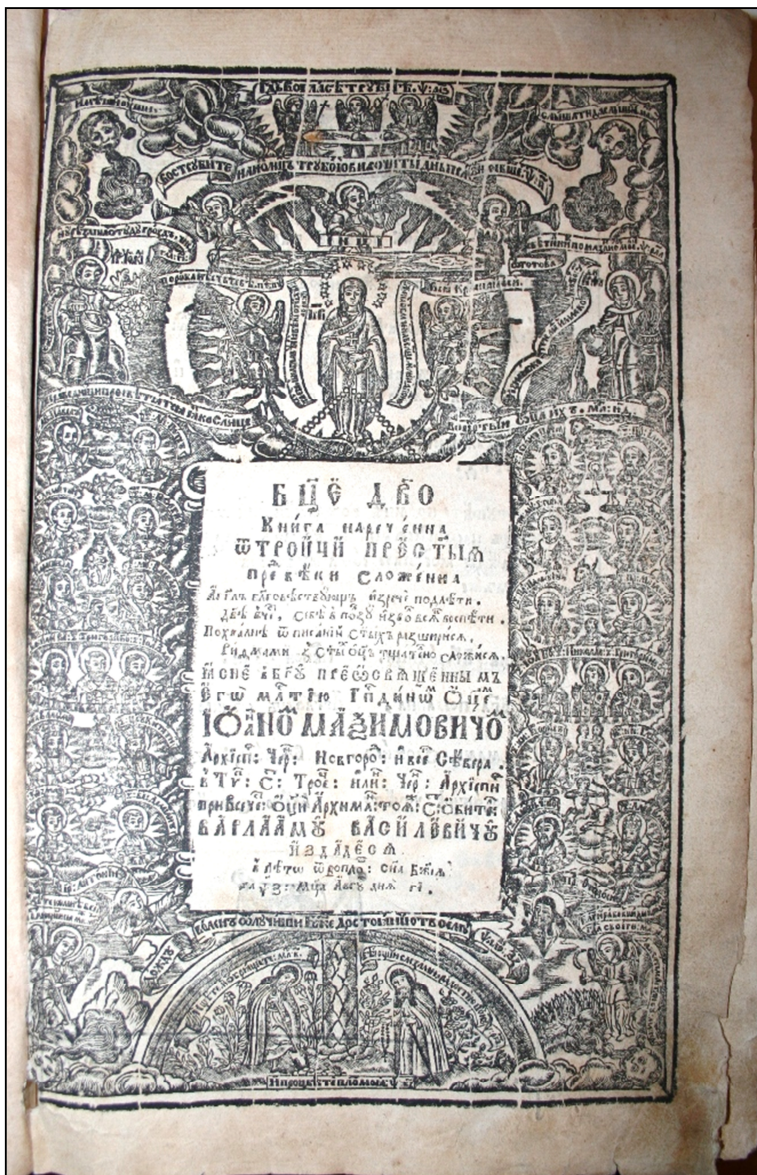
Максимович І. Богородице Діво. Чернігів, 1707