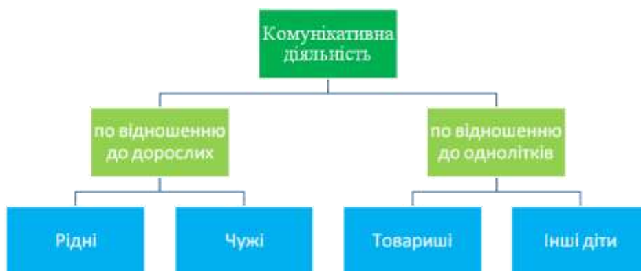
Рис. 3.2. Спрямованість комунікативної діяльності дітей старшого дошкільного віку.

Метод спостереження дав можливість з'ясувати наявність чи відсутність зрушень у комунікативному розвитку дошкільників. Здійснивши 10 сеансів спостережень за комунікативною діяльністю дітей у спілкуванні, грі, під час виконання різних трудових доручень, було виявлено спрямованість комунікації. В результаті чого, ми виділили звернення дітей спрямоване до однолітків (товаришів, інших дітей) і до дорослих (рідних, чужих). На рис. 3.2. схематично зображено спрямованість комунікації дошкільників.