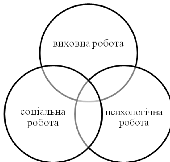
Рис. 1. Компоненти соціально-виховної роботи з неповнолітніми засудженими

Соціально-виховна робота складається з трьох компонентів: