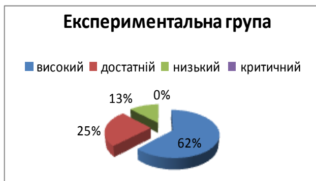
Рисунок 2. Рівні мовленнєвого розвитку старших дошкільників після формульовального експерименту

Аналіз результатів засвідчує, що після довготривалої експериментальної діяльності, отримали позитивні зрушення у мовленнєвого розвитку старших дошкільників. Узагальнені дані після формульовального експерименту представлено в порівняльних діаграмах (Рис. 2).