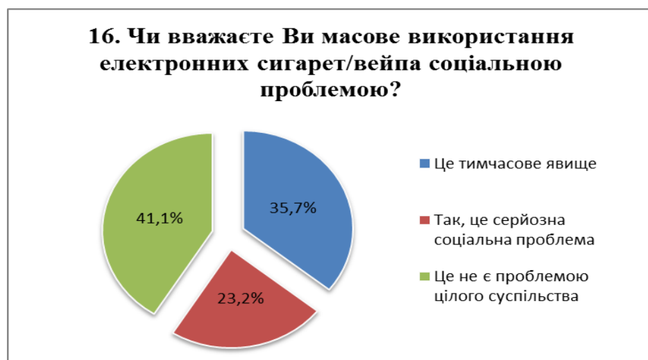
Рис. 10. Розподіл відповідей на питання №16

Практично 36% респондентів вважають використання електронних сигарет/вейпів тимчасовим явищем (рис. 10), а це може означати, що незабаром використання даних гаджетів серед молоді припиниться. Але, як показує практика, немає гарантій, що на зміну одному «шкідливому аксесуару» не прийде інший.