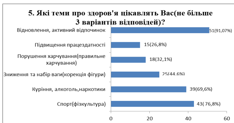
Рис.3. Розподіл відповідей на питання №5

Щодо збільшеної кількості учнів серед 9 та 10 класів (чверть від усієї кількості опитаних), які вибрали варіант відповіді «нейтрально», можна пояснити двома причинами. Перша - відсутність контролю і профілактики шкідливих звичок в стінах навчального закладу; зміна оточення (кола спілкування) до якого необхідно в короткі терміни адаптуватися і проявляти гнучкість у відносинах, в тому числі у ставленні до проблеми куріння.