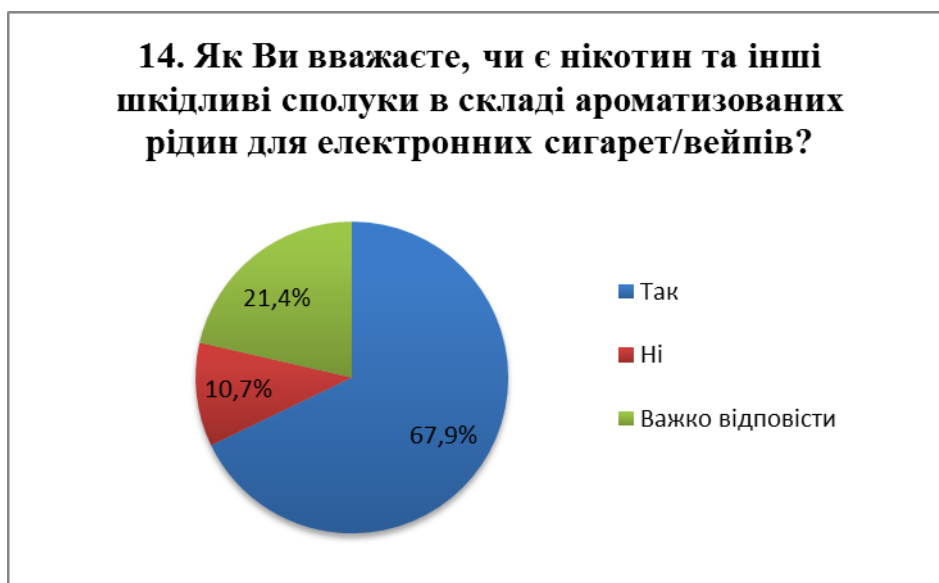
Рис. 8. Розподіл відповідей на питання №14

Сучасний ринок переповнений різними варіаціями ароматизованих рідин для електронних сигарет. Виробники заявляють, що існують рідини, що не містять нікотин. Однак у складі таких рідин вказується мінімальна кількість нікотину. У зв'язку з цим було сформульовано питання № 14. Переважна більшість опитаних усвідомлюють, що в складі будь-яких рідин є нікотин (рис. 8). Це означає обізнаність дітей, щодо складової електронних сигарет/вейпа.