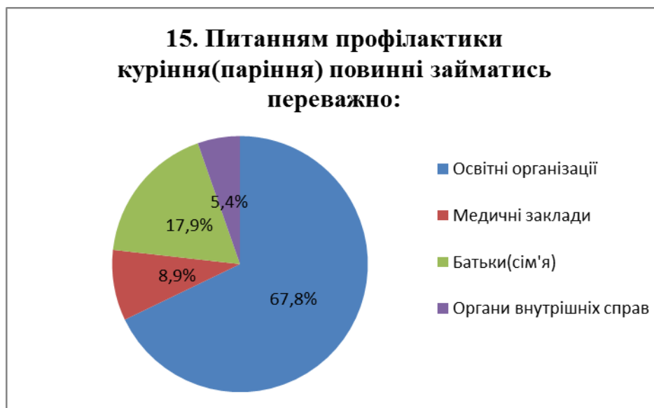
Рис. 9. Розподіл відповідей на питання №15

профілактикою даного питання. Тобто, діти розуміють, що саме приклад батьків, їх відношення до паління звичайних сигарет, електронних сигарет/вейпів відіграє на формуванні відношення дітей до цих пристроїв.