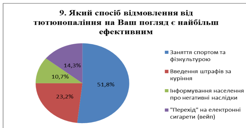
Рис. 6. Розподіл відповідей на питання №9

Але в сучасному суспільстві все більш популярним стає здоровий спосіб життя, який, безумовно має на увазі відмову від шкідливих звичок. Дана проблема була порушена в питанні, що стосується способів відмови від тютюнопаління (рис.6).