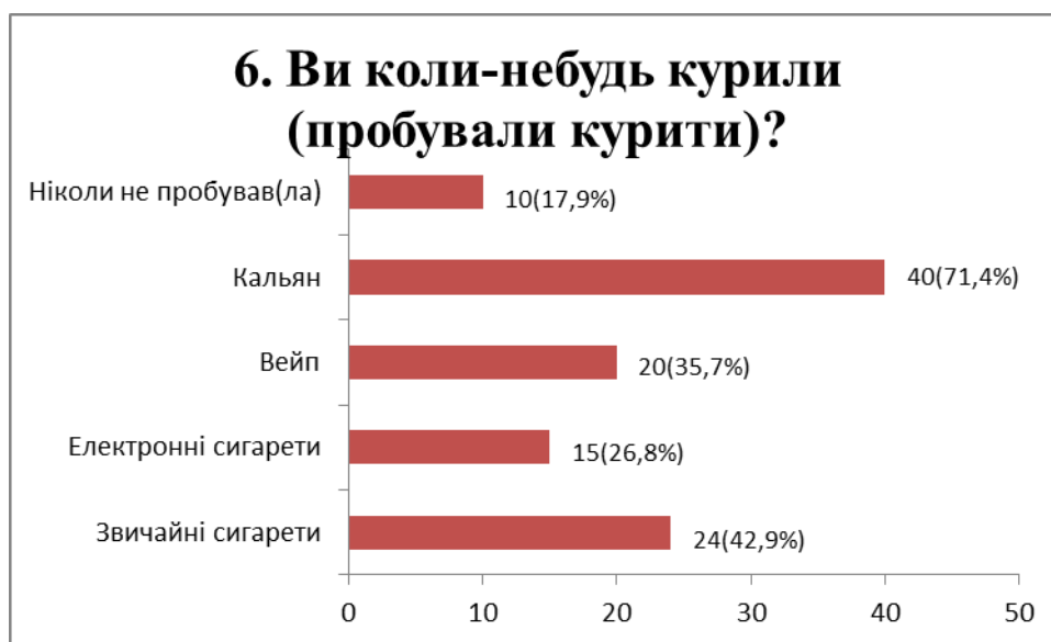
Рис. 4. Розподіл відповідей на питання №6

Досвід вживання нікотиновмісних речовин - одна з ключових частин опитування (рис. 4)