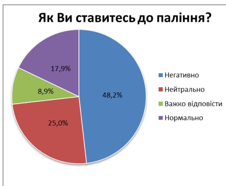
Рис.2. Розподіл відповідей на питання №4

З точки зору аналізу розподілу відповідей на питання №4, ми можемо констатувати його неоднорідність. Безумовно, популярна відповідь відображає негативне ставлення учнів до паління, але 25% допускають цю звичку як прийнятну в способі життя. Таке ставлення дає можливість допускати, що особистість схильна до даного явища в подальшому. Більше третини респондентів обрали відповідь «нейтрально», що характеризує пасивність у визначенні та захисту власної точки зору (рис. 2).