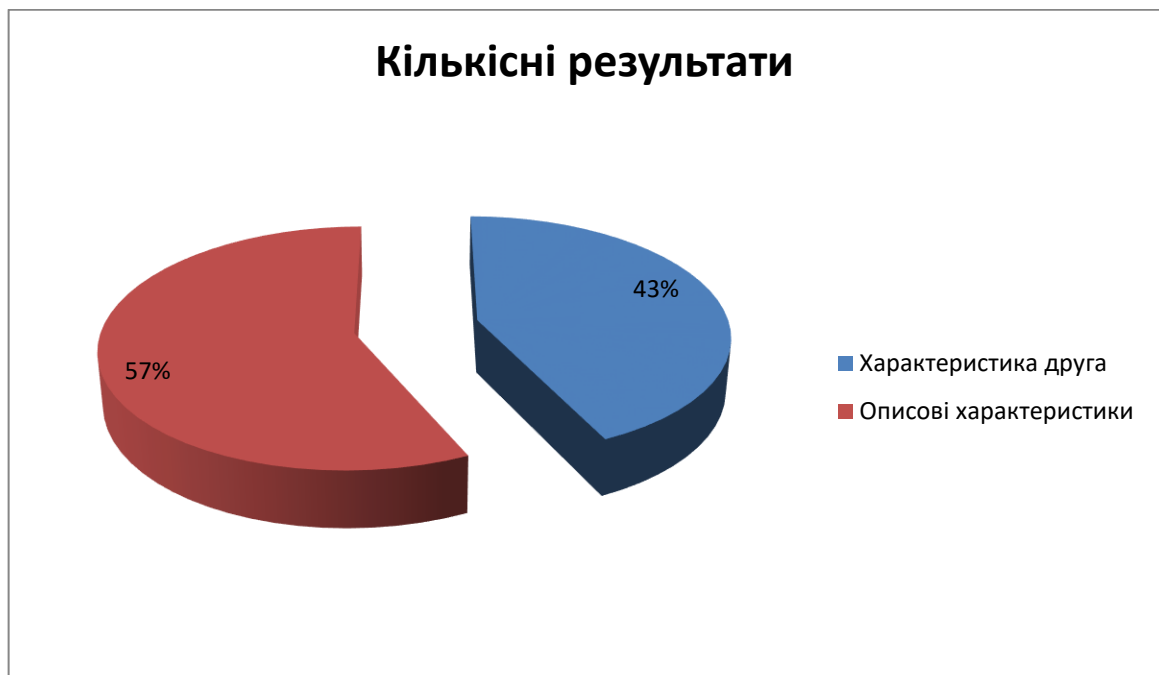
Рис.2.1 Розподіл відповідей респондентів на питання методики «Розповідь про одного»

Кількісні результати наступні: 57% відповідей дошкільників свідчать про те, що переважна кількість дітей у виборі соціальних контактів з однолітками орієнтуються на його ставлення до себе. Про це свідчать використання у відповідях на питання прийменників «Я», «мене», «мною». Власні оцінні судження не домінують, якість контактів і соціальних комунікацій знаходиться ще в процесі формування. Проте, в цілому це ознака віку і можна вважати її нормою. 43% відповідей дітей – свідчать про більш високий рівень сформованості свідомого ставлення до іншої людини, сприйняття іншого як самоцінної особистості.