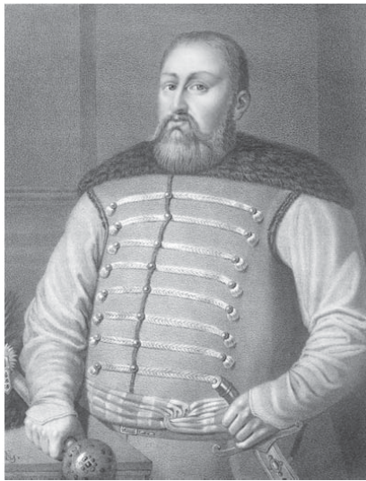
Польський коронний гетьман Микола Потоцький «Ведмежа лапа»

польського короля: «Жигимунт Третий, з ласки Божьей Король Польский, Великий князь Литовский, Русский, Прусский, Жмудский, Мазовецкий, Лифляндский, а Шведский, Готский, Вандальский дедичный король» . Польський акт 1624 року про закріплення за містом земельних угідь, наданий ніжинським міщанам польським коронним ревізором Ієронімом Цехановичем, також зазначав: «место Нежин, от многих лет опустошалое, значне за ласкою Божьею растет и щораз людей до него прибывает...» [8].