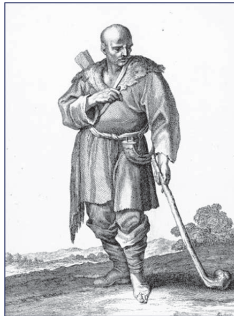
Український козак. Старовинна гравюра.

До цього «букету» суперечностей додалося протистояння релігійно-національного характеру. Польський королівський уряд, який в умовах «шляхетської демократії» був змушений боротися за зміцнення та централізацію влади, здійснював активну полонізацію місцевого населення