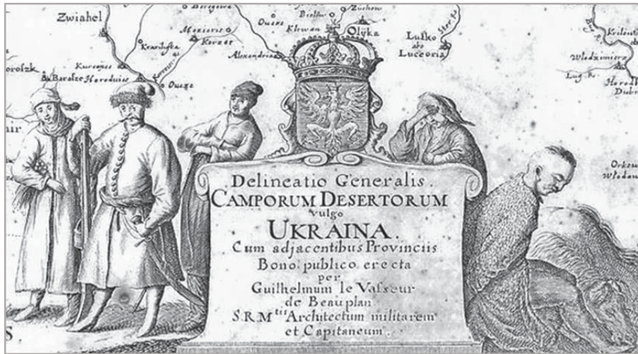
Україні на карті України Г. де Боплана першої половини XVII ст.