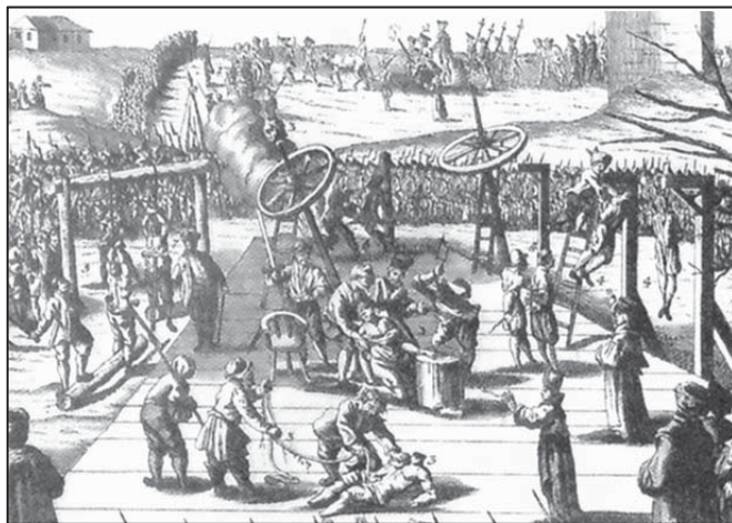
Страта бунтівників. Старовинна гравюра.