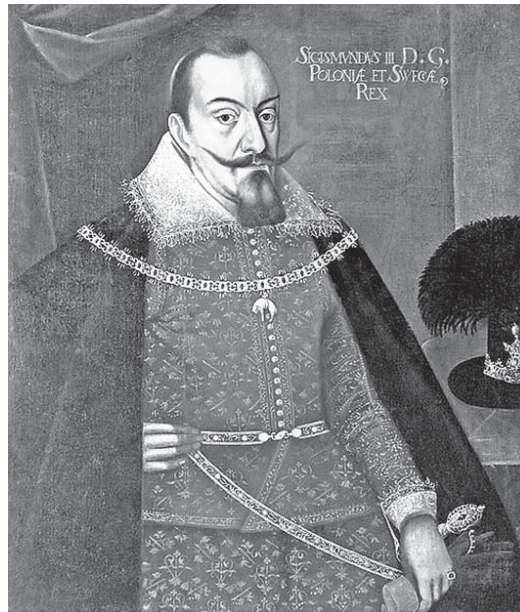
Польський король Сигізмунд III Ваза

заслонною бути может, зычим того зо всех мер, иж бы яко найлепше крепило и умножало, и до оздобы приходило, а за тим потужнейше против неприятелей и наглым небезпечностям оставало». З цією метою польський король звільняв ніжинських міщан, купців, ремісників, перекупців, шинкарів та «всякий люд міської кондиції» від особистої та майнової залежності і піддавав юрисдикції виключно Ніжинського магістрату. Міського голову (або війта ) призначав сам король з числа католиків або православних («католицького римського і руського набожества»). За влучним спостереженням відомго історика М.Н.Петровського, в цьому й полягала головна