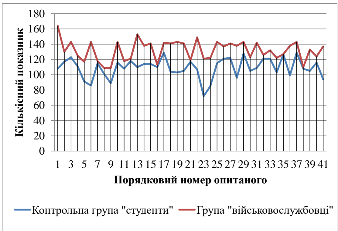
Графік співвідношення результатів двох груп