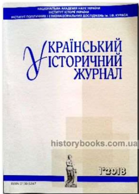
«Український історичний журнал»