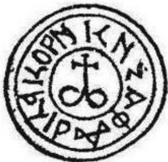
Рис. 3. Печатка князя Федора Корибутовича

Подаємо також печатки нащадків Корибута-Дмитра відповідно Зигмунта Федора (рис. 3, 4). В першому випадку це відома "вісімка з латинським хрестом" з якоревидної тамги Корибута, в другому – це вершник на коні з мечем (як варіант литовського гербу "Погоня") [7, с. 203].