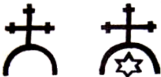
Рис. 5. Печатні знаки князів Збарських: Миколая – крем'янецького старости і Януша – брацлавського воєводи

Видозміни герба князів Збараських з часом набували окремих деталей, але базовий "кросслет" та півмісяць були присутні завжди (рис. 5, 6) [9, с. 120].