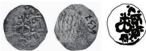
Фото та прорисовка сторони зі знаком (аверса) монети князя Дмитра-Корибута Ольгердовича (1381–1404)8.

Отже, проаналізуємо сфрагістичні та нумізматичні матеріали Корибута-Дмитра Ольгердовича та його нащадків. Печатні знаки на монетах Корибута та на печатках його синів Федора та Зигмунта подаються в наступних графічних ілюстраціях [4, с. 12–13] (рис. 1, 2).