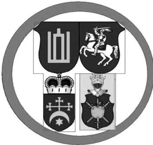
Рис. 7. Печатка Стефана Збарзького 1569 р. (монтаж автора)