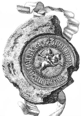
Рис. 4. Печатка Зигмунда Корибутовича

"Геральдика Польська середніх віків" д-ра Францішка Пекосінського подає наступний герб Федора Корибутовича, який можна трактувати, і як зображення на печатці цього ж князя, і як "покладену