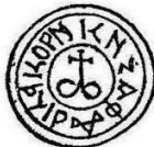
Печатка князя Федора Корибутовича.