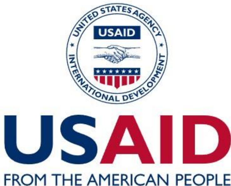
Рис. 3.5 Агентство міжнародного розвитку США (USAID)

зв'язки, побудову партнерських відносин та сприяють розвитку взаємного інтересу та співпраці між народами.