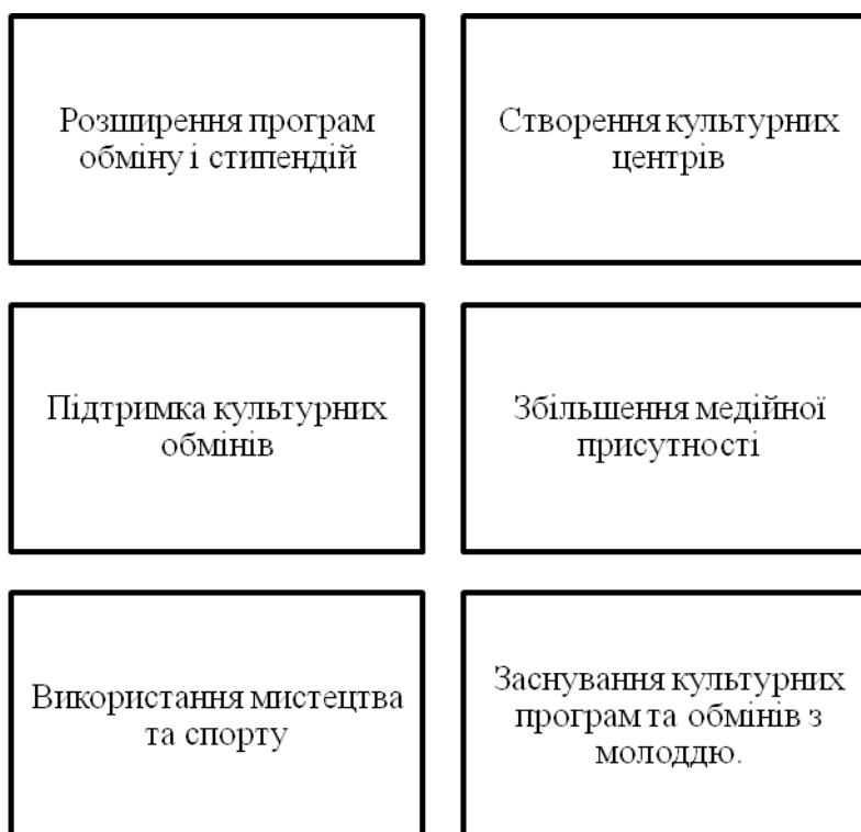
Рис. 3.1 Рекомендації щодо збільшення ефективності та впливу культурної дипломатії КНР

Культурна дипломатія відіграє важливу роль у зовнішній політиці країни, сприяючи зміцненню взаєморозуміння, співробітництва та підтримки між націями. Китай, з його багатовіковою культурною спадщиною, відіграє все більш вагомую роль на міжнародній арені, тому ефективне використання культурної дипломатії стає надзвичайно важливим для Китайської Народної Республіки (КНР). З метою збільшення ефективності та впливу своєї культурної дипломатії, КНР може врахувати кілька рекомендацій (Рис. 3.1).