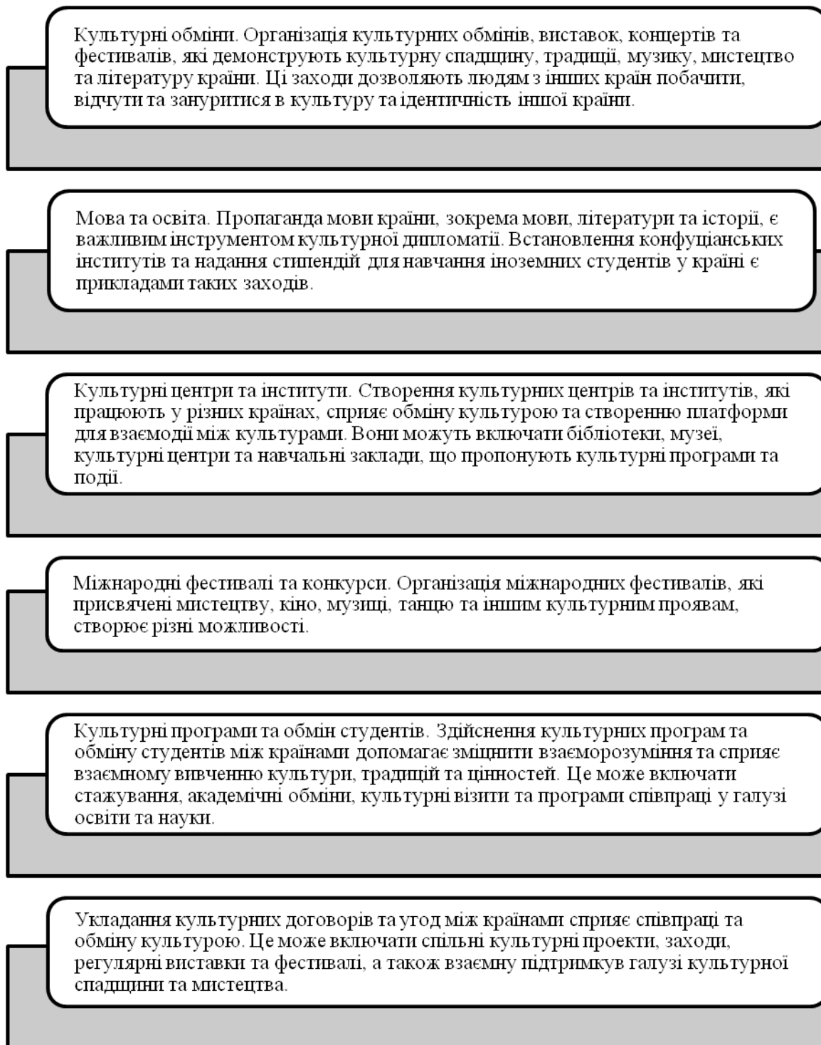
Рис. 2.5 Ключові інструменти, що використовуються в культурній дипломатії

Проте, у Китаї все ще існує проблема з просуванням своєї культури, оскільки вона далеко не завжди сприймається іншими країнами. Наприклад, існують певні звинувачення у плагіаті китайських художників та урбаністів, що можуть відлякувати інші країни від подальшої співпраці в цій галузі [28].