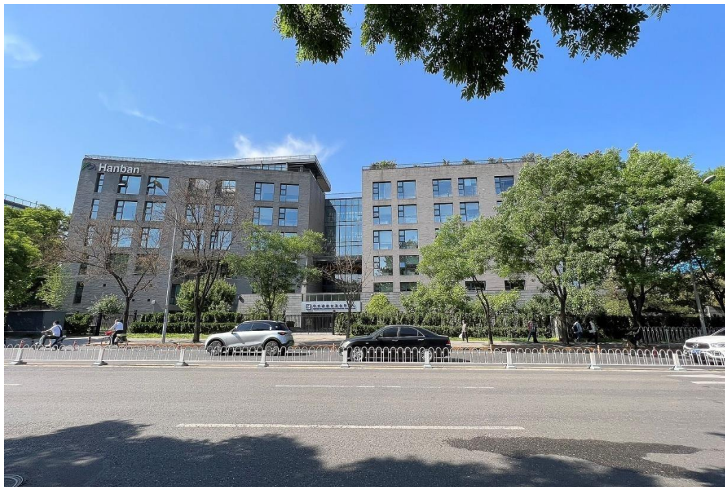
Рис. 2.2 Штаб-квартира Ханьбянь

Важливо відзначити, що «Ханьбан» часто стає предметом дискусій і критики у деяких країнах через спроби китайського уряду впливати на навчання китайської мови та культури за кордоном. Деякі обвинувачують «Ханьбан» у поширенні пропаганди та контролі над академічною сферою. Такі обговорення продовжуються, і погляди на роль «Ханьбан» різняться в залежності від контексту та країни, в якій вона діє (Рис. 2.3).