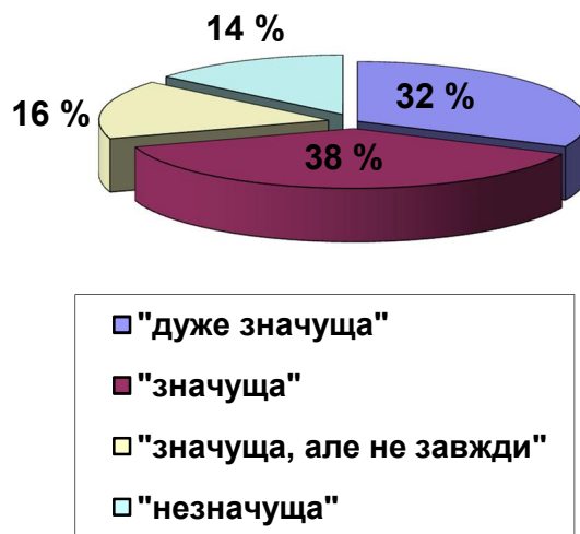
Рис. 1. Значущість професійної відповідальності в управлінській діяльності менеджера (за самооцінними судженнями студентів)

Така діагностувальна картина дозволяє дійти висновку про недостатню поінформованість магістрантів щодо суті та функціональної ролі професійної відповідальності в майбутній управлінській діяльності і необхідність формування підвалин професійної відповідальності на етапі підготовки майбутнього менеджера.