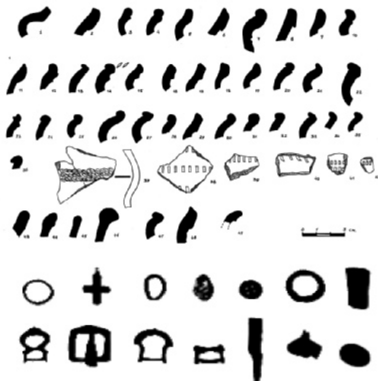
Археологічний підйомний матеріал із поселення Магерки-1