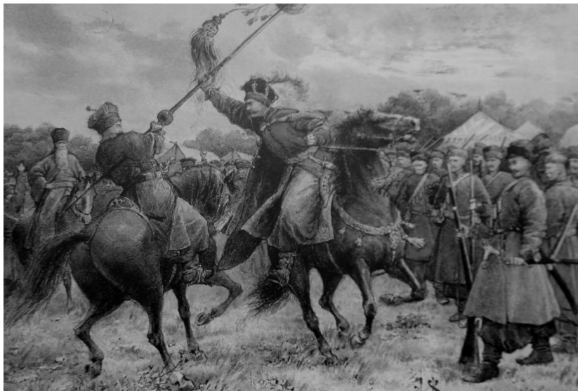
Чорна рада 1663 р. в Ніжині. Ілюстрація до роману П. Куліша. Худ. А. Ждаха

Відповідальна місія посланців чернігівського єпископа готувалася у глибокій таємниці і була ретельно законспірована. До нас дійшов зашифрований лист Лазаря Барановича до намісника Ієремії, написаний польською мовою з Макошинського монастиря напередодні Ніжинської ради, який, на перший погляд, виглядає як інструкція з управління монастирським господарством (так, до речі, його й трактували