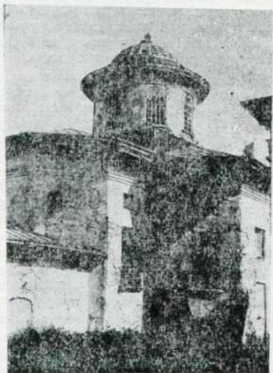
Грецька Михайлівська церква. 1714—1749 рр.

цікаві книги, серед яких — рукописні грецькі євангелія X—XII ст. з власноручними примітками візантійського імператора Феодосія, дуже гарно оздоблені євангелія XVI ст. на «молдовлахійском наречии», євангеліє, видане на кошти гетьмана Івана Мазепи арабською мовою в Алеппо (Сирія) з гетьманським гербом.