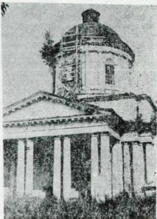
Грецька Всіхсвятська церква. 1767—1805 рр.