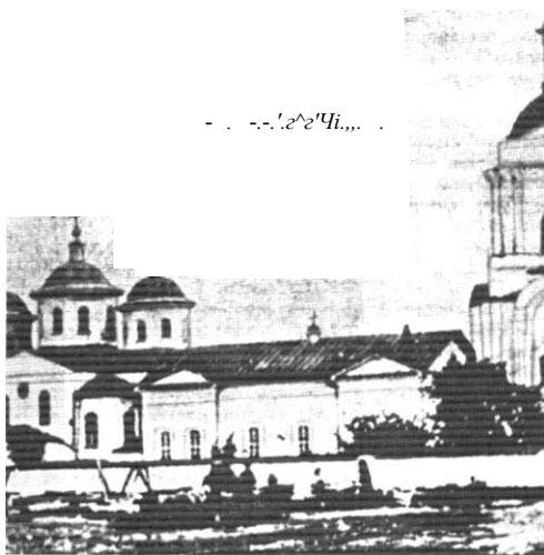
Спасо-Преображенська церква після перебудови ХІХ ст.

Бурхливі події ХХ століття позначилися й па долі Спасо-Преображенського храму. З 1924 р. у ньому правила службу Божу іромада Української Автокефаль-