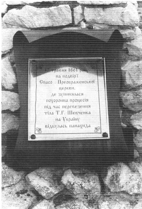
Пам'ятний знак на місці панахиди за Т. Г. Шевченком

іої Православної Церкви. Після розправи у 1930-х роках над «автокефалістами» войовничі атеїсти добралися й до самого храму. Снасо-Преображенську церкву було закрито, а в ній розташували військовий склад. Як розповідають старолітці, влітку 1941 р., коли місто залишали підрозділи Червоної армії, то приміщення церкви разом з військовим майном просто спалили. А після війни, наприкінці 1950-х років, з допомогою вибухівки знищили дзвіницю та теплу церкву, які буцімто заважали рухові транспорту.