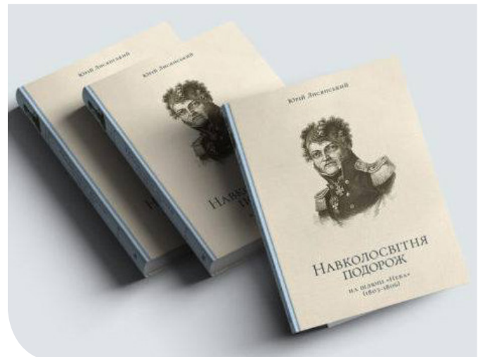
Нове перевидання книжки Лисянського