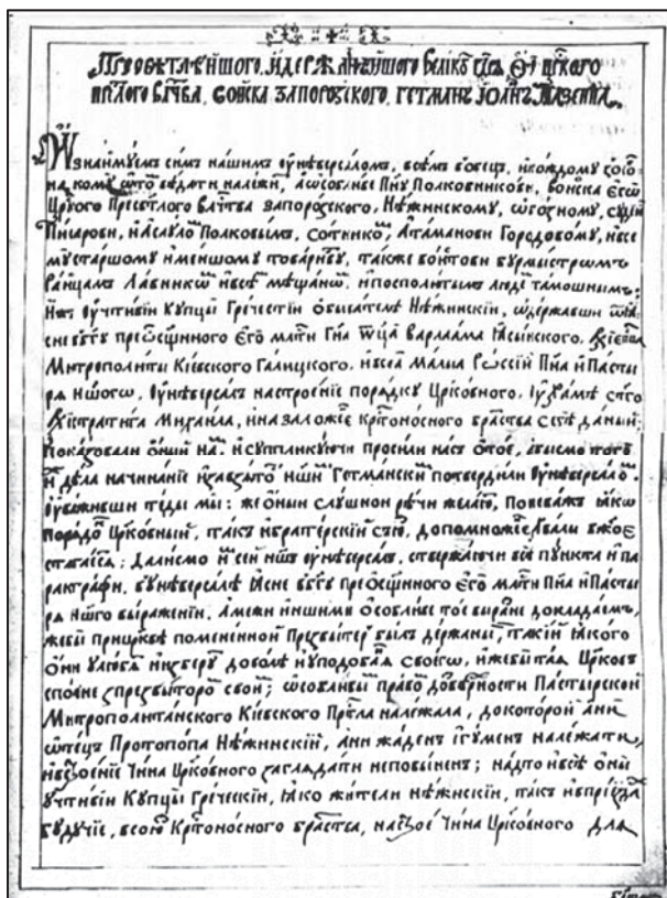
Універсал гетьмана І.Мазепи ніжинським грекам 1696 р. (Синодик Ніжинського грецького братства, ІР НБУВ)

церков, у 1687 р. релігійна громада Ніжинських греків оформилася у церковне братство, статут якого написав сам Христофор Димитрієв. В заснуванні братства активну роль відіграв гетьман Іван Степанович Мазепа, відомий своїм благодійництвом та прихильністю до створення нових духовних та освітніх закладів. Пракично вже через півтора місяці після свого обрання, 13 вересня 1687 року, гетьман видав ніжинським грекам оборонний універсал, у якому підтверджував усі права, надані його попередниками, та особливо наголошував: «...Супликовали до нас учтивіи купцы греческие, в Ніжині найдуючиєся, просячи усилонне, абысмы им позволили о ділех купецких, и о всяких межи ними діючихся справах, также и о трафунковых межи челяди их проступствах и заводах самым судитися... Теды мы яко прозбе их учтивых купцов усилонной давши у себе містце..., діла их купецкие, и всякие sprawy самым межи собою расправовати, и всякие заводы и звады люб межи товариством их... судити и успокоивати позволяем; тылько мают они и повинни будут в трудных справах и криміналох подобных до суду нашего Енерального войскового удаватися...» Окремо гетьман підкреслював: «... абы от жадного межи их и от челяди их ничего такого не походило, чтобы з кривою и прихростю ніжинским albo инным обывателем» [6].