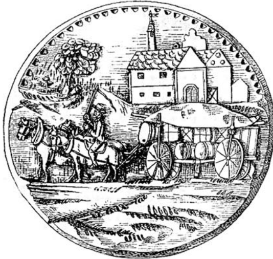
Купецька фура. Малюнок XVII ст.

Ніжин по праву вважають одним з наймальовничіших міст Лівобережної України. Воно справді вражає величністю та численністю храмів. Справжніми окрасами історичного центру стародавнього Ніжина ось вже близько трьох століть залишаються архітектурні перлини – грецькі церкви Архістратигів Михаїла й Гавриїла та Всіх Святих, які утворюють єдиний історико-культурний комплекс. Драматичною та насиченою подіями була історія цих храмів. Нероздільно пов'язана вона з діяльністю грецької громади, що існувала в Ніжині протягом XVII-