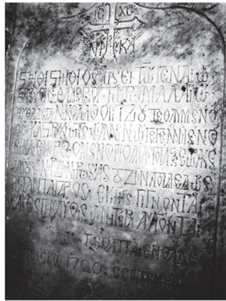
Грецька епітафія 1720 р. з Михайлівської церкви

Постійне зростання грецької громади в Ніжині та збір достатніх коштів дозволили грекам розпочати у 1714 році перебудову дерев'яної Архангело-Михайлівської церкви. За дозволом гетьмана Івана Скоропадського на місці попереднього дерев'яного храму вони заклали мурований фундамент. Будівництво тривало понад 10 років, його завершив у 1729 році священник Микола Бошняк (Босняк). Останній і був ктитором храму протягом 1719-1739 років. 28 травня 1731 року храм освятив митрополит Київський Рафаїл Заборовський. Ця урочиста подія в житті ніжинських греків увічнена написом на мармуровій дошці, яка і досі зберігається в інтер'єрі храму. «Приходський літопис» грецької Михайлівської церкви початку XIX ст. так подає зміст цього меморіального напису: «Воздвигнут сей храм Архистратигов Михаила и Гавриила при ктиторстве господина Миколая Михайловича Босняка, коему храму заложено основание из согласия всех братьев 1714-го году, и оставалась без производства работ до 1725 года. Затем, продолжая работу, окончен в 1729 году, и по приезде из Киева архиерея господина Рафаила, освящен в 1731-м году расходами братьев» [17].