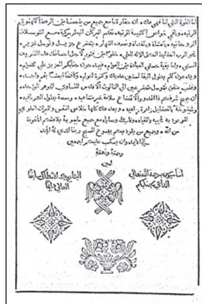
Арабське Євангеліє гетьмана І.Мазепи

У бібліотеці Ніжинського грецького братства, крім рукописів Діонісія, зберігалося чимало інших унікальних книг, серед яких – рукописні грецькі Євангелія XI-XII століття на пергаменті з власноручними примітками візантійського імператора Феодосія, розкішно оздоблені золотом і кольоровими мініатюрами «молдовлахійські» євангелія XVI століття, богослужбові рукописні книги та стародруки, подаровані братству фундатором священиком Христофором Дмитрієвим та його наступниками. Заслугує на увагу рукописний «Октоїх» на крюкових нотах 1671 року, що належав Константинопольському патріарху Діонісію. Дарчий напис свідчив, що цю книгу патріарх особисто подарував «митрополиту руському» Стефану Яворському. Був у бібліотеці і особистий подарунок Івана Мазепи – Євангеліє, видане арабською мовою на гетьманські кошти в сирійському місті Алеппо та прикрашене його родовим гербом. Ці рідкісні книги, серед яких є чимало справжніх зразків середньовічного книжкового мистецтва, зараз зберігаються у фондах інституту Рукопису Національної бібліотеки України ім. В. Вернадського [14].