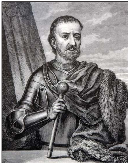
Гетьман Іван Мазепа

Науковий інтерес до історії козацько-гетьманської доби, висвітлення діяльності політичних діячів із збереження української державності в контексті європейських зовнішньополітичних відносин XVII-XVIII ст. визначають актуальність даного дослідження. У 2009 р. виповнилося 300 років від дня поразки шведсько-козацького війська під Полтавою та укладеного напередодні битви українсько-шведського союзу. Згідно наказу Президента України проводилися круглі столи, дискусії, бесіди за участю вчених, студентів, присвячених 300-річчю подій, пов'язаних з виступом гетьмана І.Мазепи та укладенням українсько-шведського договору. З'явилася можливість розширити спектр досліджень, проаналізувати історіографічну спадщину, краєзнавчі матеріали, зокрема, з історії Гетьманщини часів Північної війни (1700- 1721). Ніжинський козацький полк протягом 1700- 1709 рр. відіграв одну з ключових ролей в історії Лівобережжя.