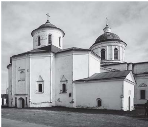
Грецькі храми Ніжина

торгівлі при умові сплати податку гетьманському «екзактору». Так, в універсалі від 2 травня 1657 року проголошувалося: «Всім вобець и кождому зособна, кому о тим відати належит, а меновите: паном полковником, асаулом, сотником, атаманом и всему товариству..., также атаманом городовим, войтом, буристром, и на якої колвек услуже нашої будучим людем, доносимо до ведомости, и ж мы, приохочуючи греков купцов, абы в сторону нашу з розными товарами прыежджаючи выгодою людем были, міти хочем и сурово розказуем, а жебы жаден по