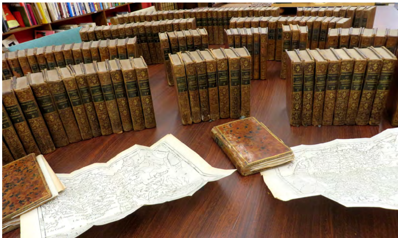
Унікальне просвітницьке видання "Bibliothèque Universelle Des Dames", яке видавав у 1786-1788 французький просвітник та філософ Мішель Монтень. З бібліотеки Безбородьків (Музей рідкісної книги НДУ імені Миколи Гоголя)