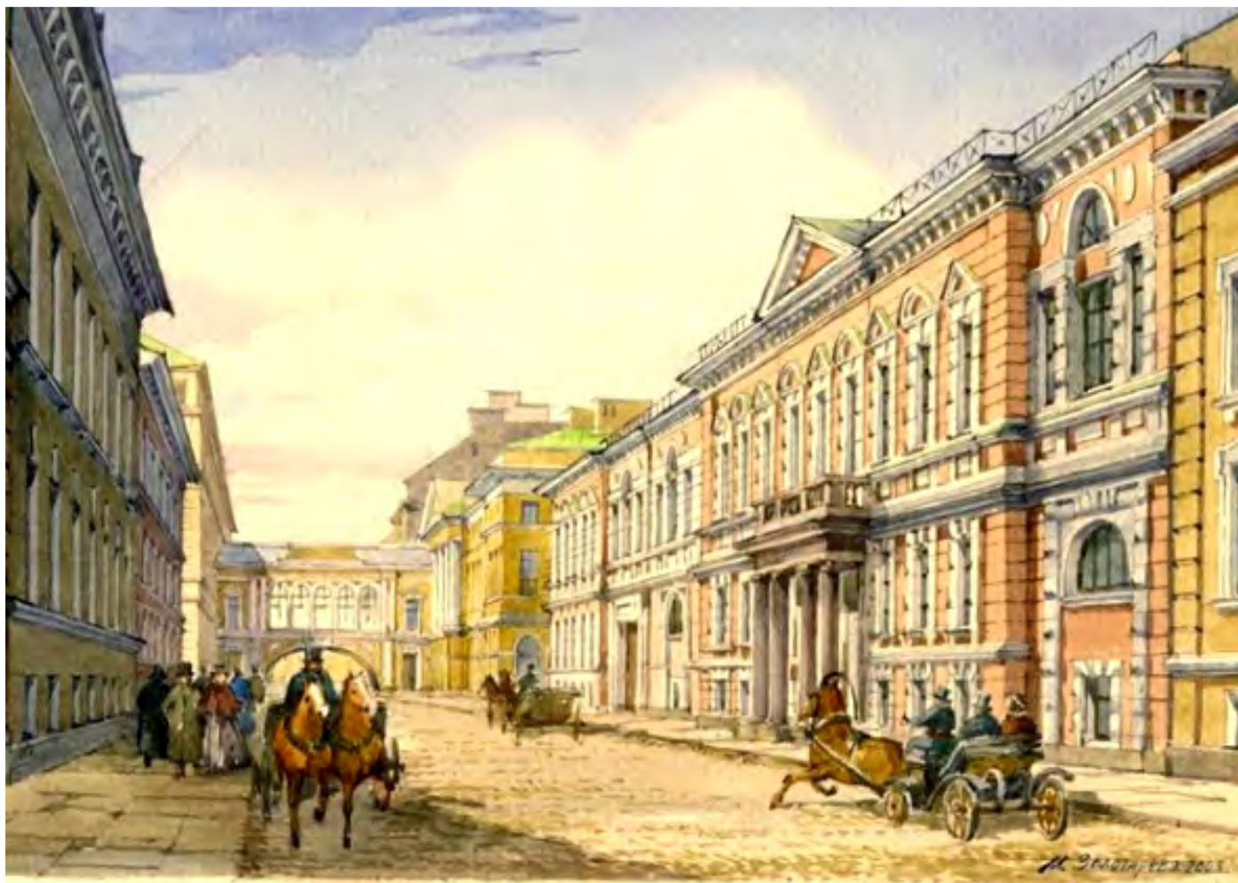
Палац канцлера О.Безбородька у Санкт-Петербурзі