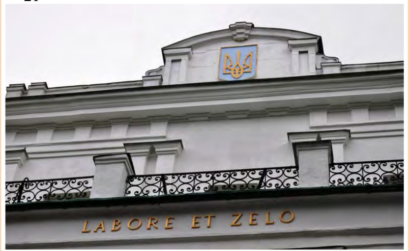
Герб князя О.А. Безбородька. Девіз: «Працею і старанням» на фронтоні університету