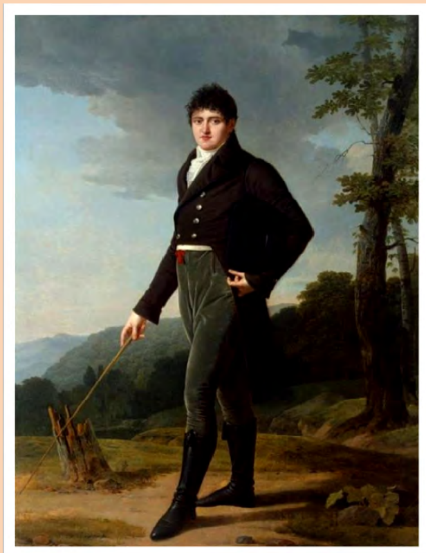
Андрій Ілліч Безбородько (5 грудня 1783 р. – 22 червня 1814 р.) Портрет Робера Лефевра, 1804 р.