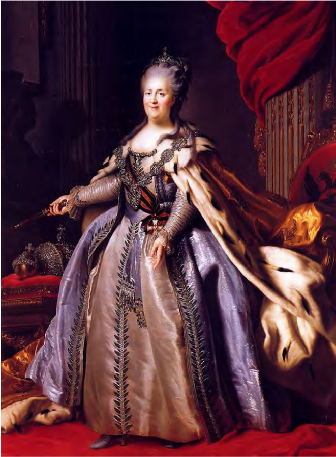
Портрет Катерини II (1780 р., худ. Олександр Рослін)

У 1777 році Катерина II пожалувала село Веркіївку генерал-поручику графу Вітгенштейну. В цей час йому належала також садиба сучасного університету. Але в 1786 році веркіївські землі переходять у власність таємного радника двора її Імператорської величності графу О.А.Безбородька. За ревізією цього часу у Веркіївці мешкало 1399 виборних козаків, козаків підпомічників і 1226 поміщицьких селян. 85 відсотків цих селян належало О. А. Безбородьку.