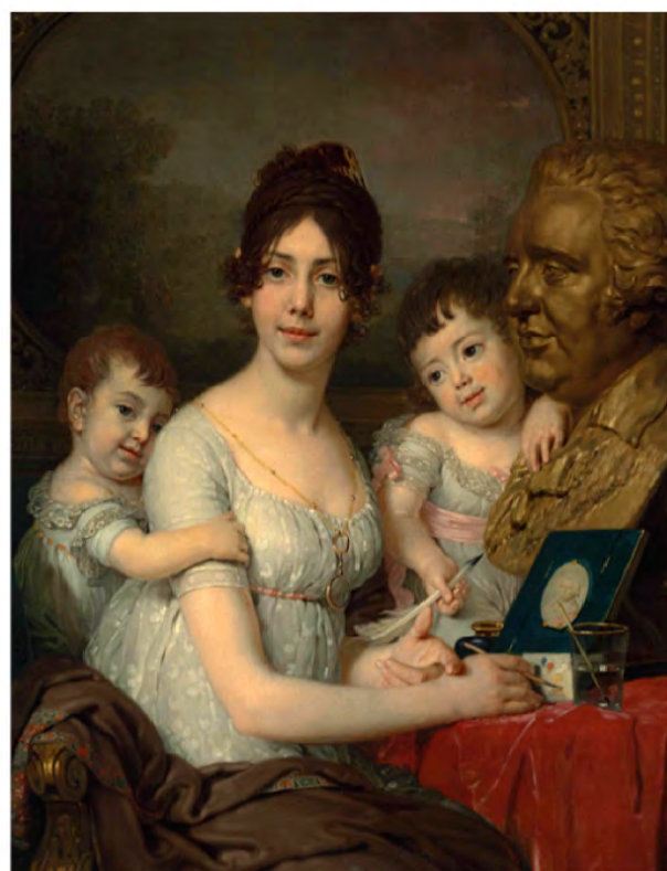
Графиня Любов Іллівна Кушелєва, (ур. графиня Безбородько), донька І.А. Безбородька