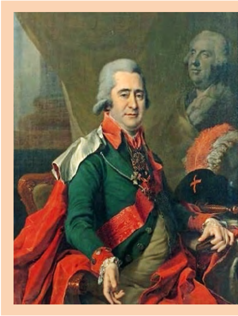
І.А. Безбородько. Портрет роботи художника Д. Г. Левицького, 1810-ті рр.

радник, державний канцлер, граф, член Російської Академії Наук, почесний член Академії Мистецтв, член Колегії закордонних справ, світліший князь, царський сенатор, канцлер Російської імперії, кавалер ордену Андрія Первозванного, Св. Олександра Невського, Св. Володимира I ступеня, старший брат Іллі Андрійовича Безбородька.