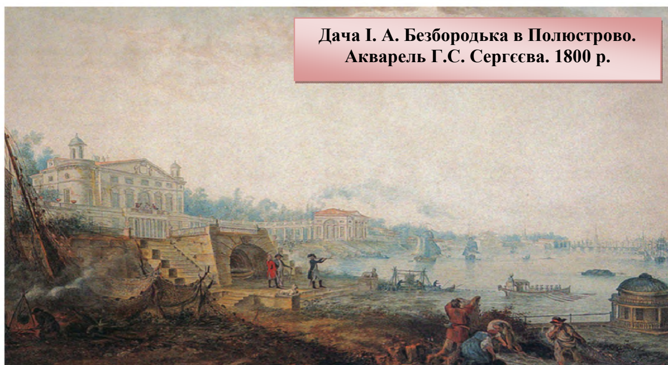
Дача І. А. Безбородька в Полюстрово. Акварель Г.С. Сергеева. 1800 р.