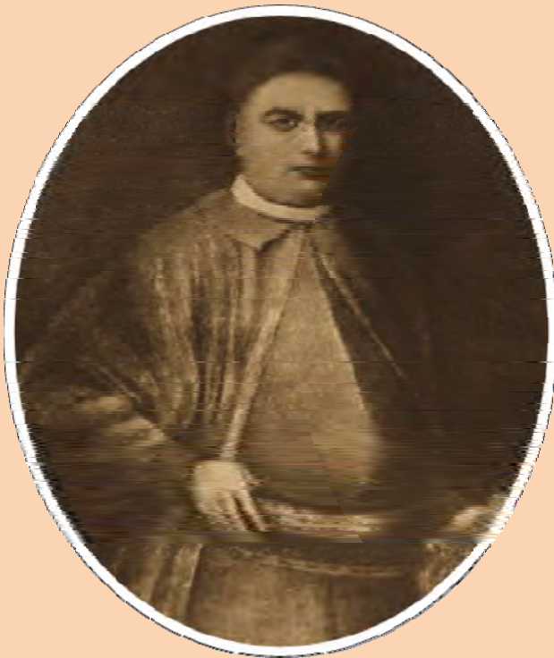
Андрій Якович Безбородько

Ілля Андрійович Безбородько походив з української шляхетської родини нащадків козацької старшини. Він був сином Андрія Яковича Безбородька, генерального писаря Війська Запорозького, та Євдокії Михайлівни Забіли.