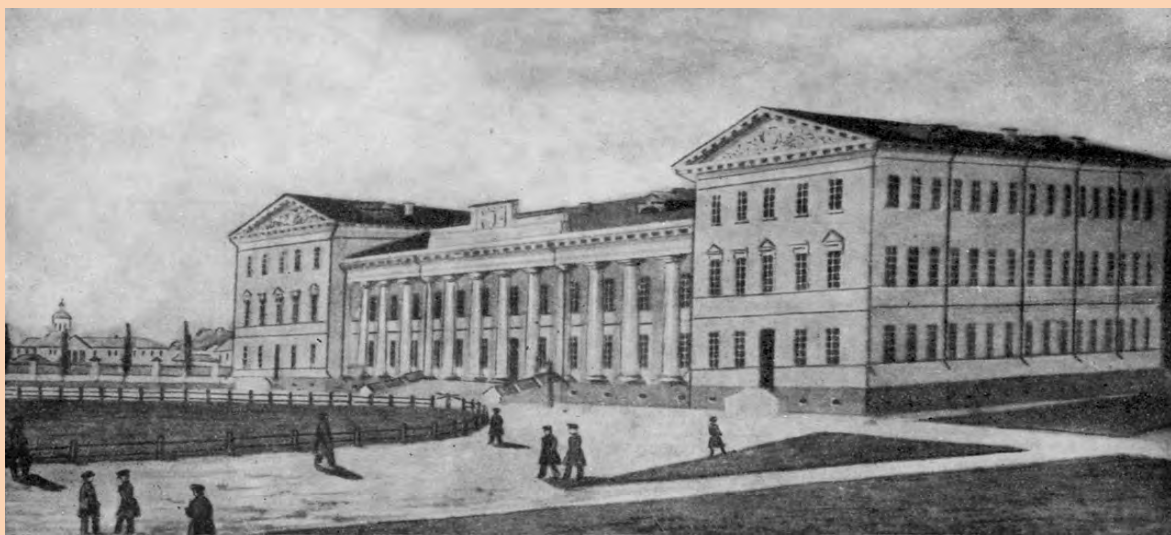
Ніжинський ліцей. З акварелі О. Б. Візеля. 1830-і рр.

Історія Ніжинської гімназії вищих наук пов'язана з ім'ям князя Олександра Безбородька, канцлера Російської імперії, та його брата, графа Іллі Безбородька. Брати Безбородьки пожертвували для будівництва цього навчального закладу більше 600 тисяч карбованців – колосальну на той час суму. Відкрилася Ніжинська гімназія вищих наук 4 вересня (за старим стилем) 1820 р.