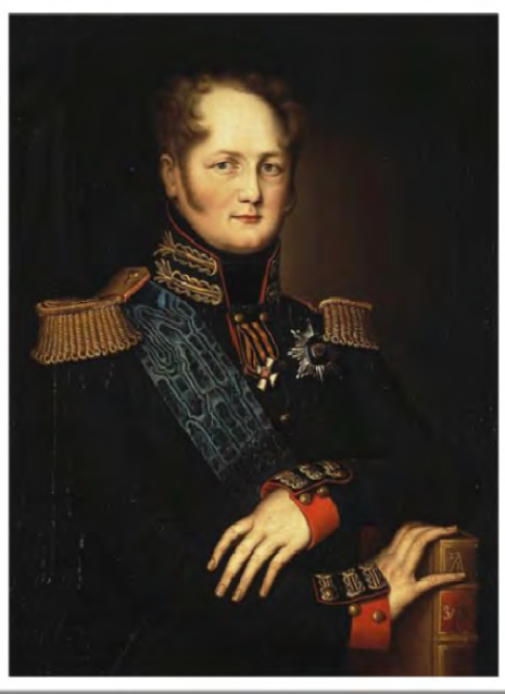
Портрет Олександра I, невідомий художник, початок XIX століття.

2. По истечении сего времени, чрез восемь лет, по 20 000 рублей... Желая исполнить оное в точности и обратить его пожертвование наиболее полезнейшим образом для общества, я купно рассуждал, что нигде удобнее оно употреблено быть не может, как в Малороссии, отчизне моего покойного брата... Я