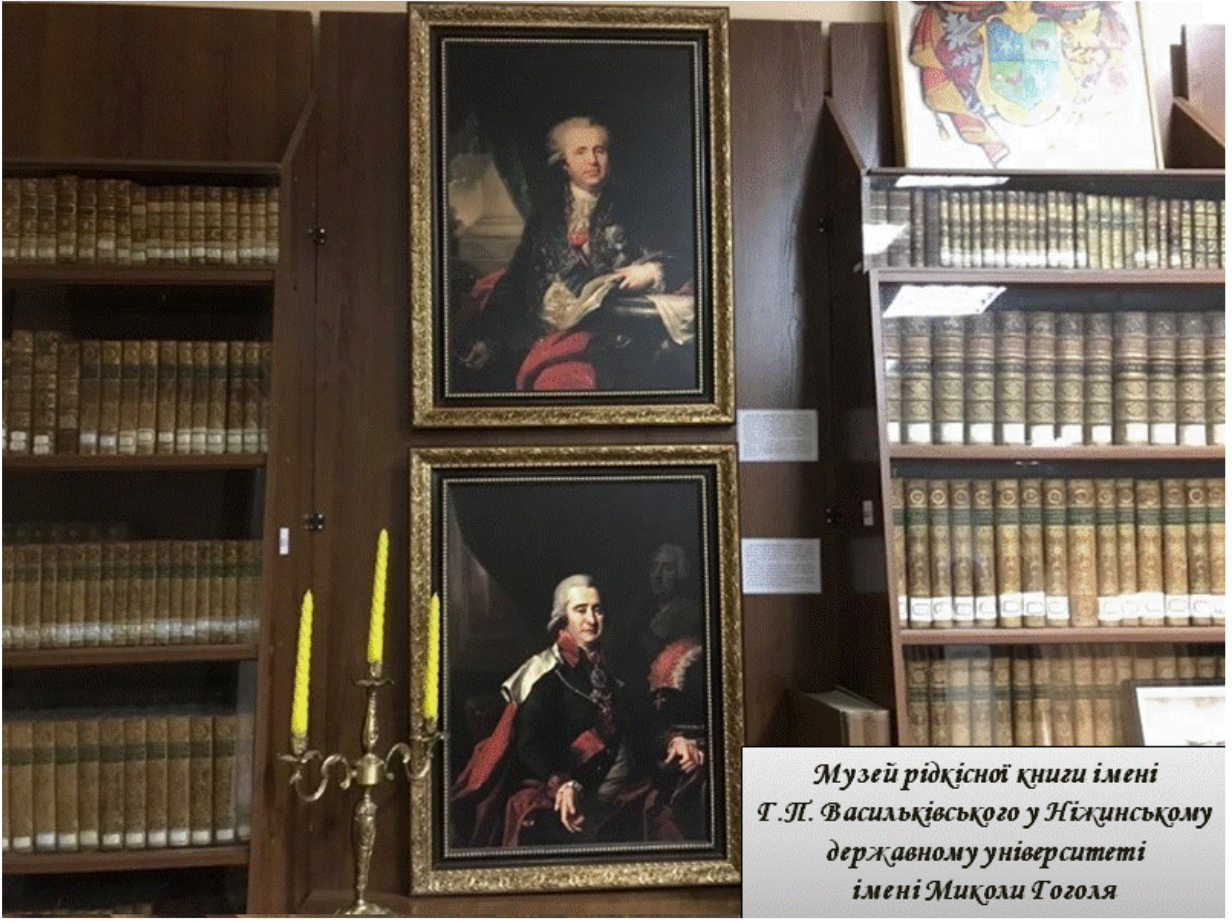
Музей рідкісної книги імені Г.П. Васицького у Ніжинському державному університеті імені Миколи Гоголя