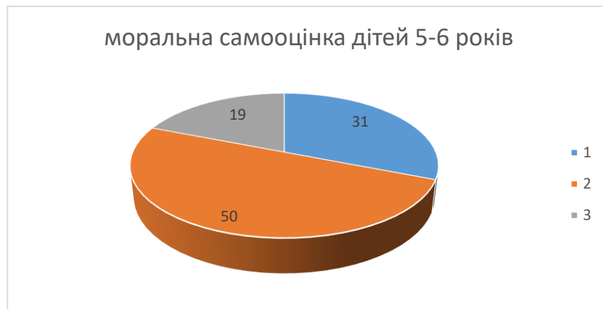
Рис 2. Групи дітей 5-6 років з різним рівнем моральної самооцінки

Найбільшою є група досліджуваних, які вважають себе більшою мірою моральними, ніж невихованими. Графічно означені вище категорії дошкільників, які відвідують старшу групу ЗДО представлені на діаграмі.