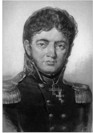
Портрет Ю. Ф. Лисянського. Худ. В. С. Чеботарев