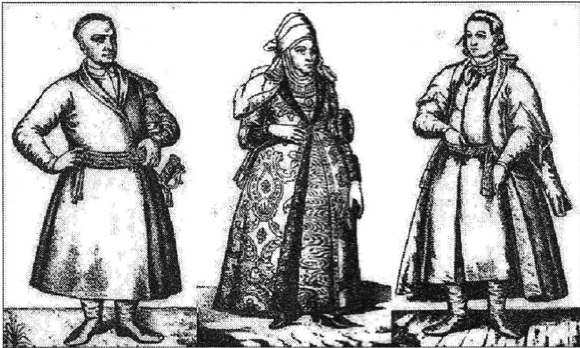
Українська шляхта XVIII ст.: сотник, шляхетна пані, козацький канцелярист

Згадуваний у документі Геракліуш Лисянський (Herakliusz Lisański, 1702–1771) гербу «Лис», якого ніжинські Лисянські вважали своїм безпосереднім родичем, – це реаль-