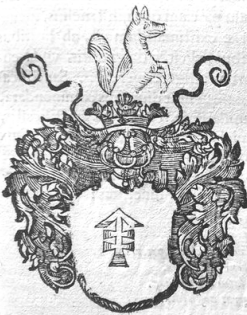
Герб «Лис» із гербовника Симеона Окозьського, 1641 р.

Nobili armorum vulpis à Calimiro primo contra Iacungos cum Lithuanis