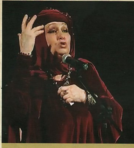
Рейса Недашківська. Браво Маріє!

Завдяки викладачу вищої категорії Коледжу, голові відділу «Видовищно-театралізовані заходи» Г. А. Кашковській, глядачі на 160-ти річчя актриси 2004 р. на сцені театру міста побачили літературно-музичну композицію «Перша народна артистка України Марія Заньковецька», де студентами з успіхом були зіграні ролі 18 персонажів, осібно, маленької, юної та дорослої Марії.