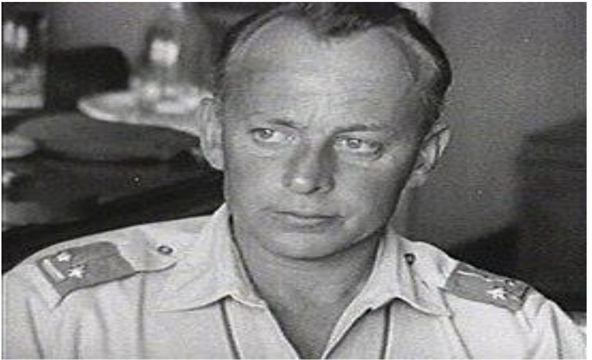
Бельгійський найманець Жан Шрамм (1929-1988 рр.).