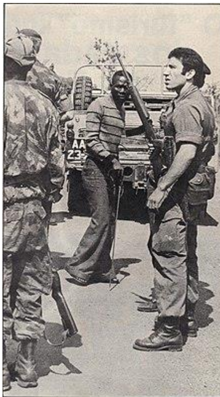
Полковник Тоні Кален - Костас Георгіу (1951-1976 рр.), командир загону найманці у Анголі.