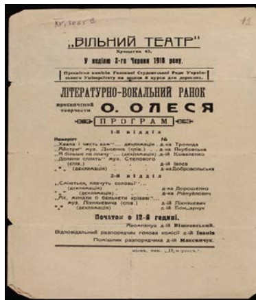
Рис. 1. Афіша «Вільного театру». 1918 р (ф. 15, од. зб. 3087). Літературно-вокальний ранок, присвячений творчості О.Олеся

Ці принципи зближують його з такими ж передовими однодумцями, які стояли у витоків «Вільного театру». Він стає одним із фундаторів цього товариства. Його можна вважати символістом і модерністом в українському театрі. Заглиблений у свою душу і почуття, він став одним із найчуттєвіших українських поетів [9, с. 24].