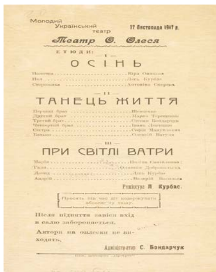
Рис. 2. Афіша вистави за О. Олесем у постановці Л.Курбаса

Вражений передовими пошуками п'єс та драматичних етюдів поета, Лесь Курбас здійснює спробу інсценізувати Олесеві твори на сцені. Як зазначає сучасна театрознавиця І. Зубченко, «Курбас називав театр Олеся храмом людського духу і в цьому храмі давав можливість відчутти не лише прекрасні, але й моторошні «таємні дрижання незглибних глибин» душі та підсвідомості» [10]. Відомо, що вистава «Театр О. Олеся» за його драматичними етюдами «Осінь», «Танець життя», «При світлі ватри» на сцені Молодого театру в постановці Леся Курбаса з'явилася 17 листопада 1917 року. Цей спектакль був спробою вивчити й дослідити природу та естетику символістського театру. Так, Лесь Курбас у своїй передмові до вистави О. Олеся наголошував, що «театр Олеся – театр вибраних <...> І завдання для актора і для режисера ясні: одкинути недоречне, другорядне, шкідливе: типовість, характерність індивідуальностей, тонкощі й вірність психологічних переживань, життєву правдоподібність гри і обстановки – і зосередити свою працю й увагу, щоб у своїй сфері держатися методу автора і ритмом і інтонаціями, рухом і жестом, почуванням і позами, світлом і тінями...» [10].