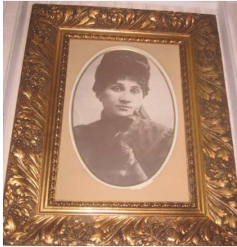
Рис. 5. Портрет М. Заньковецької.

Заньковецька також постійно виконувала на концертах українські народні пісні, що були для неї радістю життя. Про роль народної пісні у житті актриси дуже образно мовиться в одному з епізодів роману І. Пільгука «Марія Заньковецька»: «великою радістю для Марії було за-прошення Лисенка взяти участь у концерті разом з Остапом Вересаєм. Концерт під керівництвом Лисенка відбувся 11 грудня 1882 року. Проспівавши кілька пісень, Заньковецька подалась у гущу слухачів. Лисенкові пісні полонили вразливу душу. Наче обзивалися рідні голоси, в яких звучало прагнення волі, щастя» [5, с. 81]. І в зрілі роки життя мисткиню не залишали улюблені пісні: «її старість втішали своїми співами уславлені співаки М. Донець, О. Петрусенко, І. Козловський» [4, с. 11].