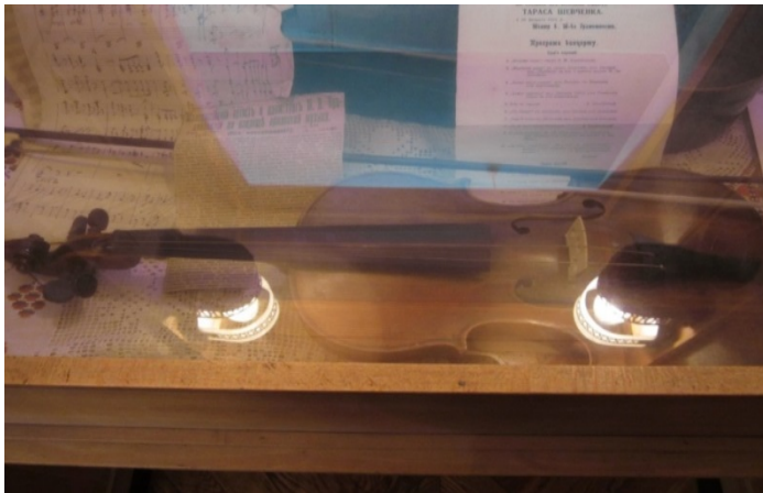
Рис. 4. Скрипка М. Кропивницького. МТМКУ.

Тож Марко Кропивницький увійшов в історію української культури не лише як письменник, драматург, театральний режисер та актор, а й як видатний композитор, диригент та співак.