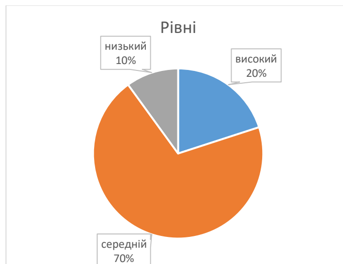
Рис.2.1 Сформованість когнітивного компонента толерантного ставлення у дітей старшого дошкільного віку до однолітків із ООП

Дані дослідження сформованості когнітивного компонента толерантного ставлення у дітей старшого дошкільного віку до однолітків з ООП можна подати на рис.2.1.