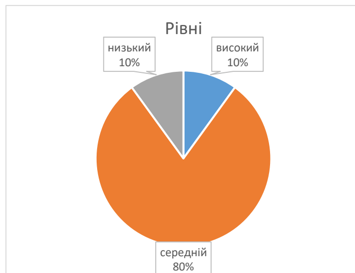
Рис.2.2 Сформованість емоційно-оцінного компонента толерантного ставлення у дітей старшого дошкільного віку до однолітків із ООП

Також було виявлено дітей, які мають низький рівень сформованості емоційно-оцінного компонента толерантного ставлення до дітей з ООП: 2 (10 %) дитини із групи. Ці дошкільнята переважно байдуже ставилися до однолітків з ООП, не розуміли їх емоційних станів, виявляли бажання піклуватися про них, допомагати їм, не виявляли співчуття, співчуття. Часто їм були потрібні навідні питання. За результатами проведених діагностичних завдань виявлення рівня сформованості емоційно-оцінного компонента толерантного стосунки старших дошкільнят до дітей з ООП групи були розділені на 3 групи відповідно до високого, середнього та низького рівнів (рис.2.2.).