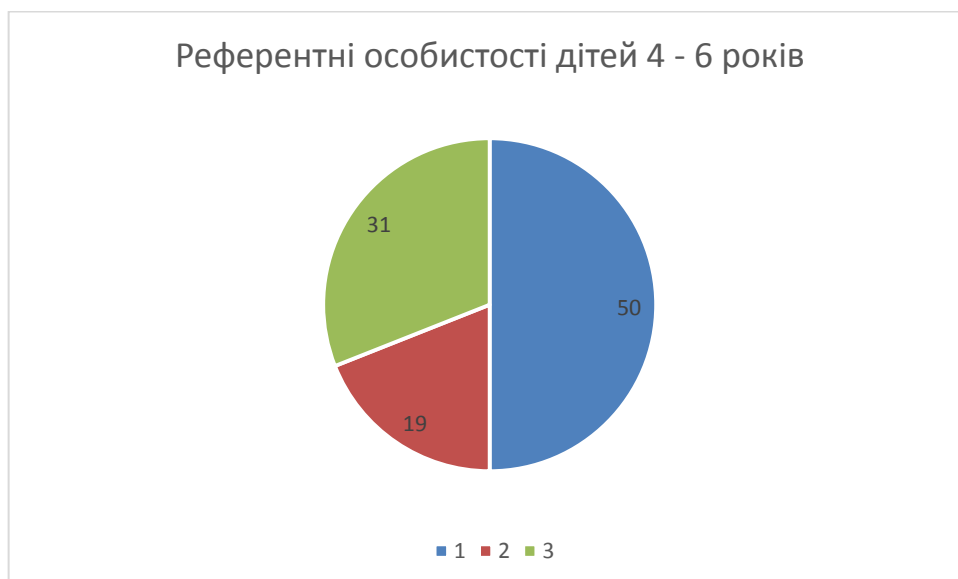
Рис. 3. Групи дітей дошкільників та їх референтні особистості

Ще одним методом у контексті вивчення означеного критерію стали показники зовнішньо-групової референтометрії. Вони дозволили з'ясувати спрямованість дітей на найбільш референтну особу у даному колективі. Під час аналізу було з'ясовано, що для дітей 4 -6 років такою особистістю, у переважній більшості, є найближчі дорослі. Коли бути надто точними – родина: мама, тато, дідусь, тьотя, дядя. Саме вони, на думку дітей, є головними персонами у їх колективі. Так, 4 -6 річні малюки й обирали та оцінювали, у більшості випадків, цю категорію дорослих. Інколи до переліку потрапляли сестри чи брати та дуже не часто найліпший друг, подруга, партнер по грі. Здійснивши діагностичні процедури, в цілому по вибірці досліджуваних виявлено: 50 % малюків надали за всіма параметрами перевагу близьким людям; друга група, виділена окремо дуже умовно, оскільки тут також найближче оточення: брати чи сестри – 19 %; нарешті, 31 % респондентів внесли до цього списку найкращих ровесників (друзів, партнерів по грі). Саме ці показники й відображено на діаграмі під номером 3.