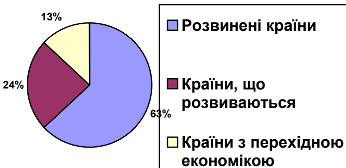
Рис.1 Квоти трьох світових угруповань у відсотковому вираженні на 3.03.15

Як видно з діаграми, 63% квот МВФ, а саме 136 млрд. 937 млн. СПЗ припадає на розвинені країни, де тільки Сполучені Штати займають 18% (39 млрд. 125 млн. СПЗ). Квоти країн з перехідною економікою займають 13% від загального обсягу, де на Україну припадає 0,576% квот МВФ, що дорівнює 1 млрд. 252 млн. СПЗ.