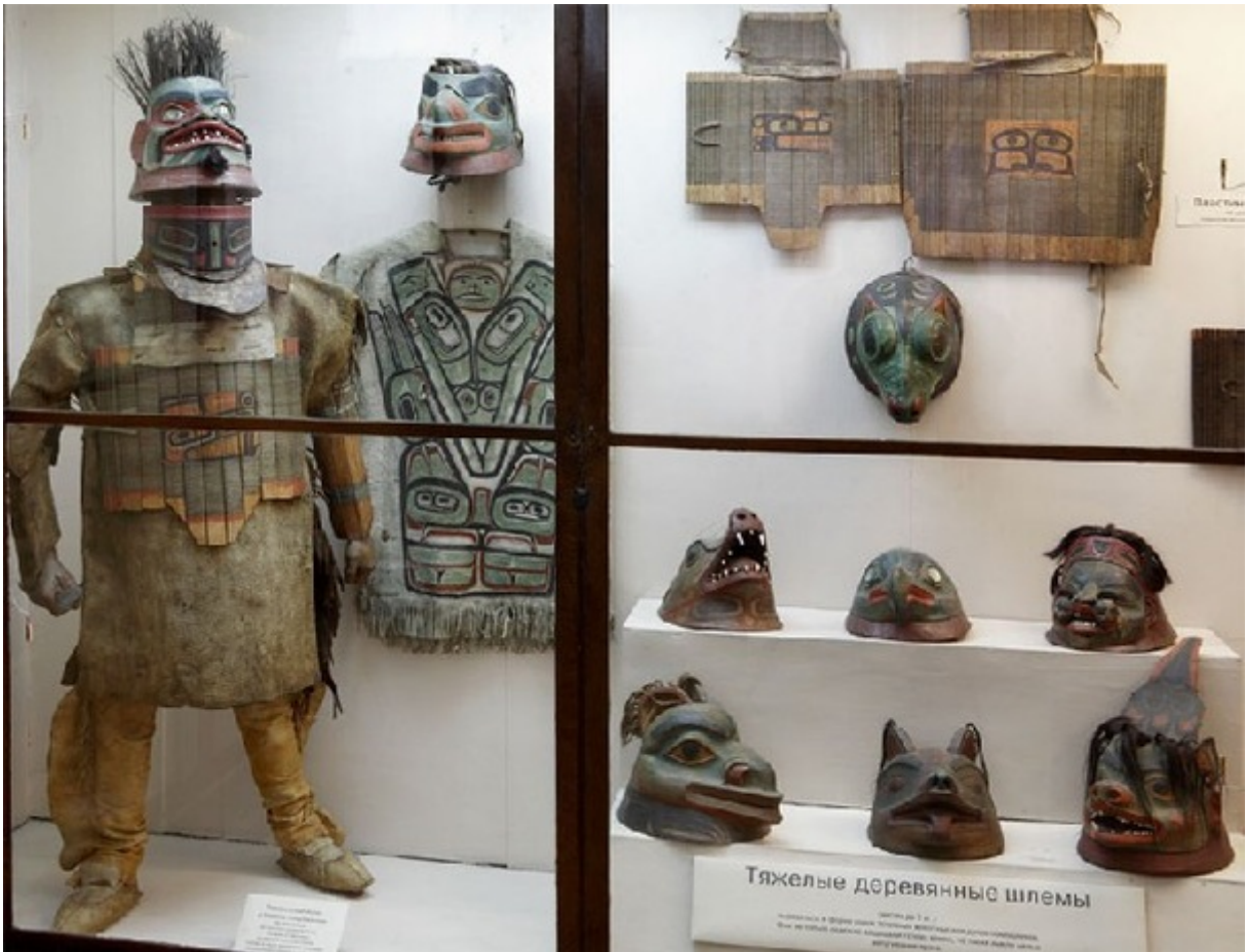
Етнографічна колекція Юрія Лисянського в музеї «Кунсткамера»

Зі смертю Юрія Лисянського не увірвався ні його рід, ні морська династія. З шести дітей двоє синів обрали військову службу, як і батько здобули освіту у Морському кадетському корпусі. Найвідомішим став молодший син Платон Юрійович Лисянський (1820-1900 рр.), який дослужився до чину адмірала, служив на Чорноморському та Балтійському флотах, був редактором наукового журналу «Морський збірник». Також відомий як письменник, меценат та реформатор військового флоту. Середній син мореплавця Юрій Юрійович, більше відомий як старець Григорій Лисянський, згадав священницьке покликання свого ніжинського діда і став ченцем на Афоні.