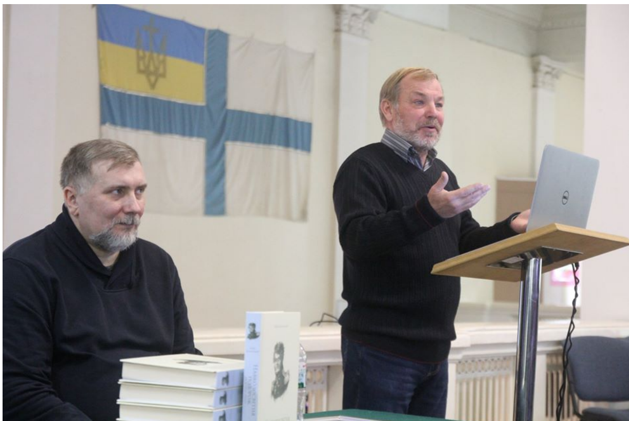
Презентація книги Ю. Лисянського в Національному військово-історичному музеї в м. Києві

-Ми звертаємося до всіх, хто може допомогти у створенні меморіальної експозиції, саме експонатами морської тематики того часу. Офіційне відкриття музею запланували на 2023 рік, до 250-річчя Юрія Лисянського, – розповів Олександр Морозов. – Уже триває кропітка підготовча робота. У грудні 2019 року у київському видавництві «Темпора» побачило перше українське перевидання книги «Юрій Лисянський. Навколосвітня подорож на шлюпі «Нева» (1803-1806)», яку підготував письменник-мариніст Антон Санченко. Він є ініціатором щорічного літературного конкурсу морської прози «Мателот» для українських письменників. Ми пишаємося тим, що видання підготовлене саме за нашим примірником книги Ю. Лисянського, який до Ніжина передав сам автор.