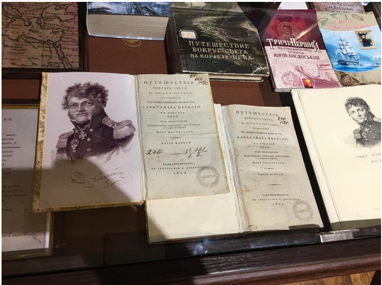
Книги Ю. Лисянського в Музеї рідкісної книги Ніжинського держунверситету