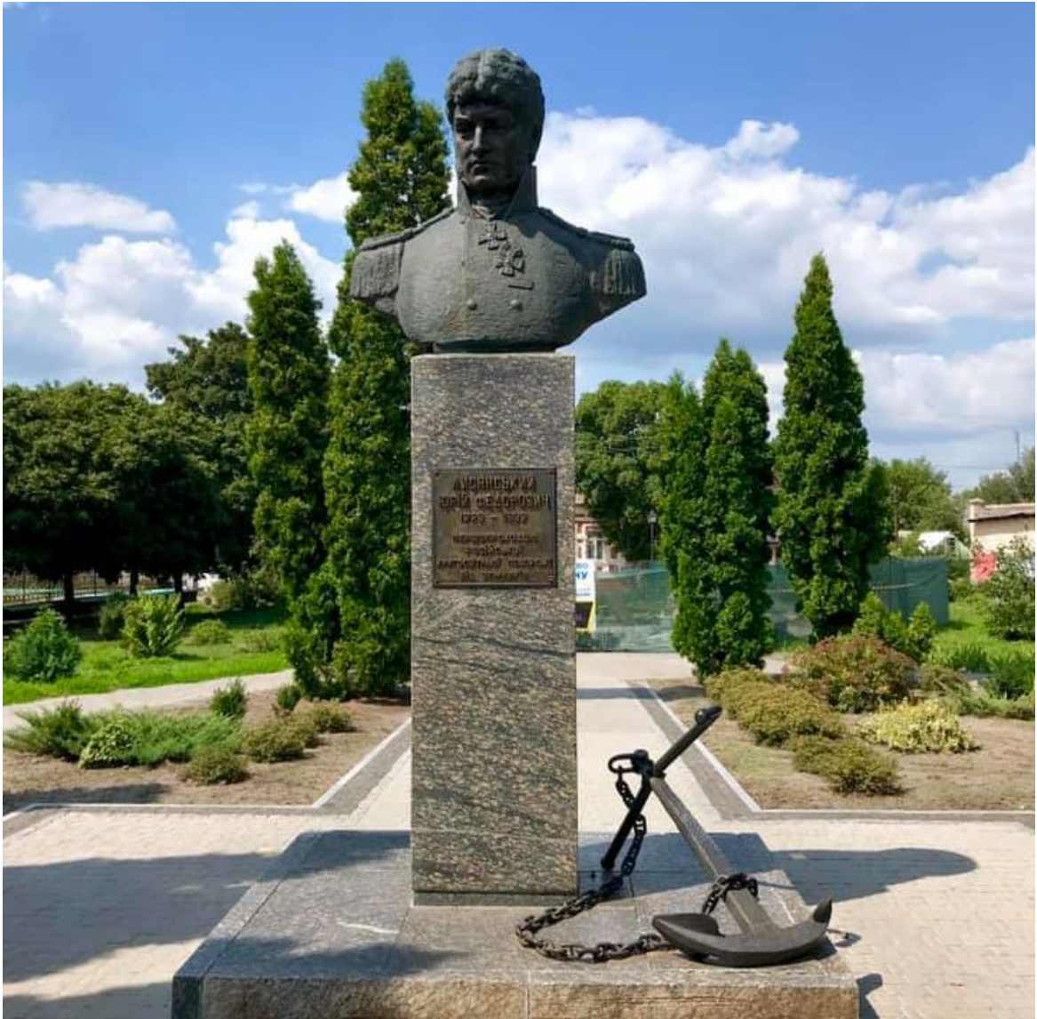
Пам'ятник Ю. Лисянському в Ніжині (1974 р., скульптор К.Годулян)

Ніжинські дослідники-краєзнавці, військово-історичні товариства, Асоціація ветеранів Військово-Морських Сил України на чолі з відомим громадським діячем, віцеадміралом Сергієм Гайдуком та діючі моряки спільно із науковцями активно долучились до відродження із забуття імені видатного українського мореплавця Юрія Лисянського. Ще у 1974 році ніжинці встановили у центрі міста пам'ятник земляку, біля підніжжя якого лежить великий «адміралтейський» якір.