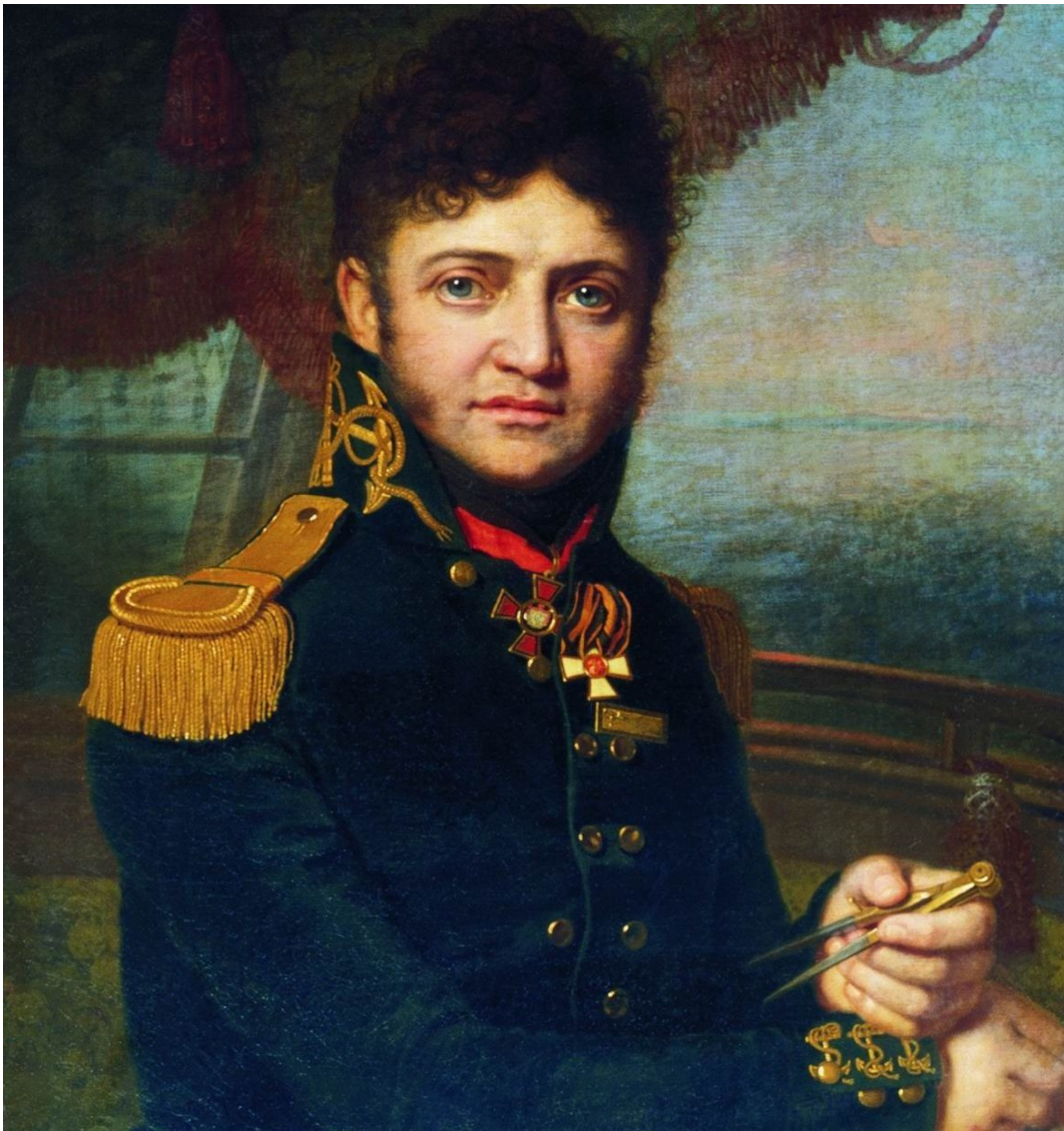
Худ. В.Боровіковський. Портрет мореплавця Ю.Ф.Лисянського, 1809 р.

Військовий моряк капітан 1 рангу Юрій Лисянський, нащадок давньої шляхетної козацької родини з Ніжина, був одним з організаторів та учасників першої в історії колишньої Російської імперії навколосвітньої подорожі. Ба більше – шлюп «Нева» під його командуванням першим повернувся до Кронштадта, на 13 днів випередивши шлюп «Надія», яким командував Адам Йоганн Крузенштерн у згаданій подорожі. Прізвищем Лисянського назвали острів на Гаваях, півострів, протоку та річку на Алясці, гору на Сахаліні. На відміну від Крузенштерна, ім'я українського мореплавця і мандрівника, дослідника, лінгвіста, географа, етнографа, океанолога, картографа та першого вітчизняного письменника-мариніста тільки тепер проходить шлях від забуття до визнання.