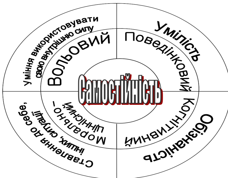
Рис. 1.1. Компоненти самостійності як особистісної якості дітей дошкільного віку

Кожен із поданих компонентів містить якийсь перелік складових, що відкривають зміст становлення незалежності в дітей дошкільного віку й виявляються в її індивідуальному розвитку.