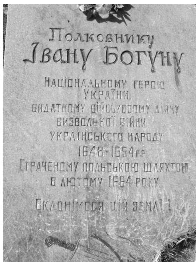
Могилу І. Богуна поблизу поблизу с. Комань.