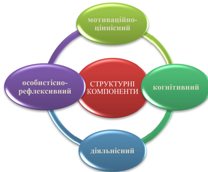
Рис. 3. Структура конкурентоспроможності менеджера сфери освіти

Мотивація, як індивідуальне утворення особистості менеджера, формується під дією зовнішніх і внутрішніх чинників і ґрунтується на мотивах. «Мотив – це внутрішнє психічне явище, яке спонукає суб'єкт до виконання дії; мотивація визначається як система внутрішніх мотивів, що спонукає людину до конкретних вчинків, форм поведінки і діяльності» [9, с. 58]. Сукупність професійних та особистісних мотивів є чітким орієнтиром і внутрішнім поштовхом для формування конкурентоспроможності майбутніх менеджерів у процесі їх професійної підготовки.