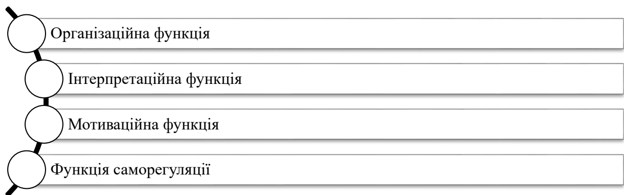
Рис. 1.1. Основні функції Я-концепції

Зарубіжні вчені зазначають, що Я-концепція як сукупність переконань й уявлень, котрі люди мають щодо себе, виступає критично вагомим елементом психологічного розуміння ідентичності, поведінки й особистісного розвитку. Будучи вкоріненою у досвіді й стосунках людини, Я-концепція виконує ряд функцій в людській психіці (рис. 1.1).