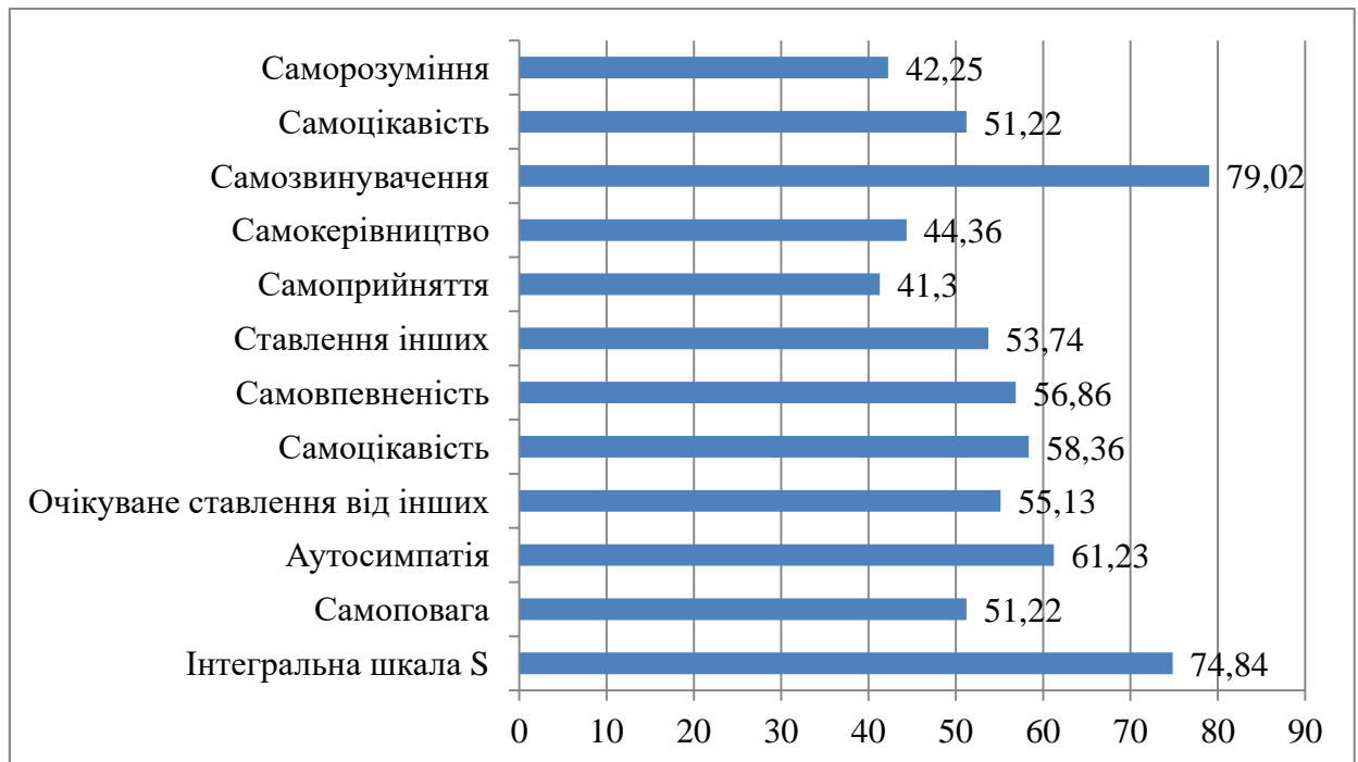
Рис. 3.1. Середні значення за даними тесту-опитувальника ставлення до себе (В. В. Столін, С. Р. Пантелєєв)

Спочатку розглянемо виявлені рівні самооцінки за методикою «Тест-опитувальник для визначення самоставлення особистості» (В. В. Столін, С. Р. Пантелєєв). Для наочності представимо результати обробки даних на рис. 3.1.