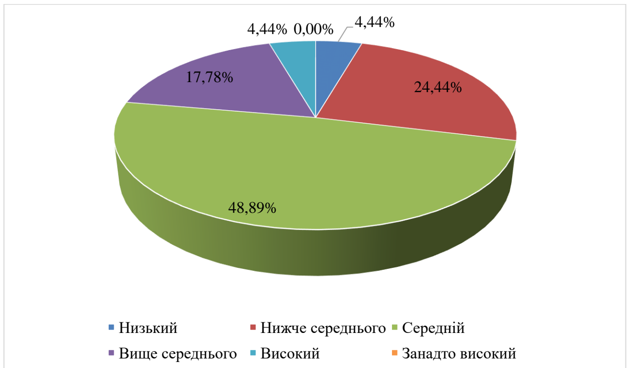
Рис. 3.3. Узагальнені результати опитування за методикою дослідження самооцінки особистості (С.А. Будассі)

Також до оптимальної оцінки відносяться «високий рівень» – 2 підлітки (4,44%) і рівень «вище середнього» – 8 підлітків (17,78%), за якого людина заслужено цінує себе, є задоволеною собою, поважає себе, а також рівень «нижче середнього» – 11 підлітків (24,44%), за якого людина поважає себе, проте розуміє власні слабкі сторони й прагне до саморозвитку та самовдосконалення.