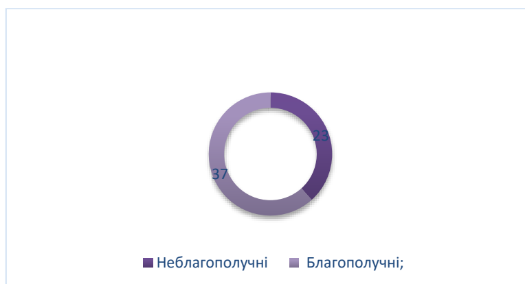
Рисунок 3.2 Задоволені(благополучні) та незадоволені( неблагополучні) шлюбом

За загальною кількістю, більшість осіб віднесені до категорії «Благополучні». Це може вказувати на тенденцію до позитивного ставлення до шлюбу серед даної групи. Однак важливо враховувати індивідуальні особливості та контекст стосунків для розуміння більш деталізованого зображення. Далі, було здійснено аналіз задоволених шлюбом з прокореляцією із всіма шкалами всіх методик по ймовірністю співпадіння.