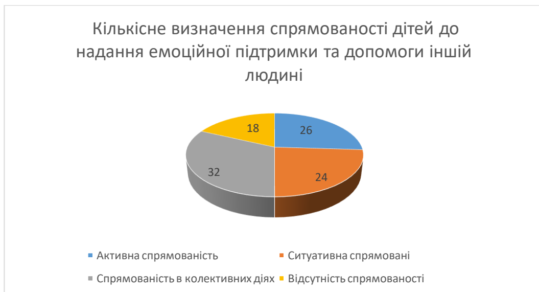
Рис. 2.1. Відсоткове кількісне визначення спрямованості дітей 6-7 років до надання емоційної підтримки та допомоги іншій людині

Ми звернули увагу на те, що переважна більшість випускників закладу дошкільної освіти виявила власну чітку позицію щодо надання підтримки іншій людині, яка потребує допомоги, у тому числі – емоційної. Кількісний розподіл старших дошкільників за результатами відповідей на питання щодо готовності надати емоційну підтримку та допомогу тим, хто цього потребує, представлено на рис. 2.1.