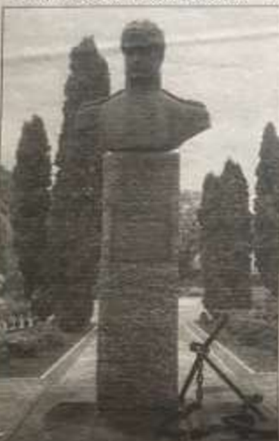
Пам'ятник Юрію Лисянському у Ніжині

Також у Ніжині була перевидана дуже важлива монографія під назвою «Тричі перший. Викатний мореплавець та географ - Юрій Лисянський». Автор книги - Віктор Шевченко, професор кафедри