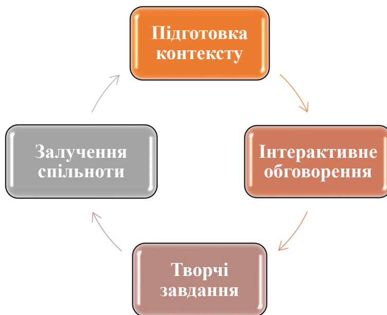
Рис. 1. Етапи підготовки та проведення віртуальної екскурсії.

культури, про яку йдеться, щоб вони поділилися своїм досвідом через відеозустріч.