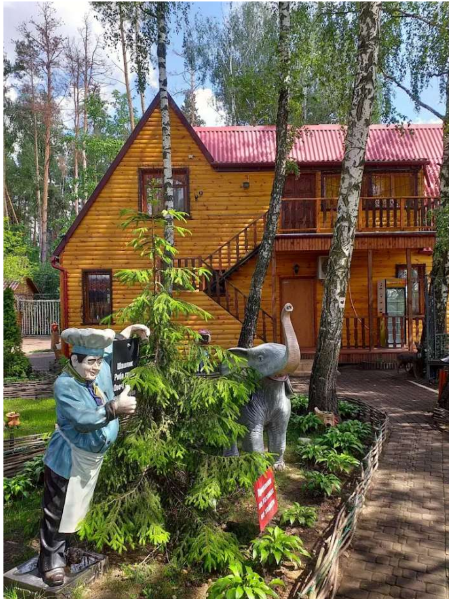
Рис. 3.8. Відпочинковий комплекс «Лісова казка» [23]

9) Відпочинковий комплекс «Купайла» село Таталаївка (Талалаївська ТГ) «Купайла» позиціонує себе, як база відпочинку з басейном/озером, альтанками, місцями для риболовлі, банкетними та банними послугами (рис. 3.9). В соціальних мережах є активні сторінки, що інформують про режим його роботи, послуги басейну з підігрівом, розважальні пропозиції та контакти для бронювання. Комплекс орієнтований на відпочинок груп гостей і сімей, а наявність водного простору, обладнання для відпочинку на воді та інфраструктури робить його органічною складовою місцевих туристичних маршрутів. Школярі можуть вивчати тут гідрологічні особливості водойм,