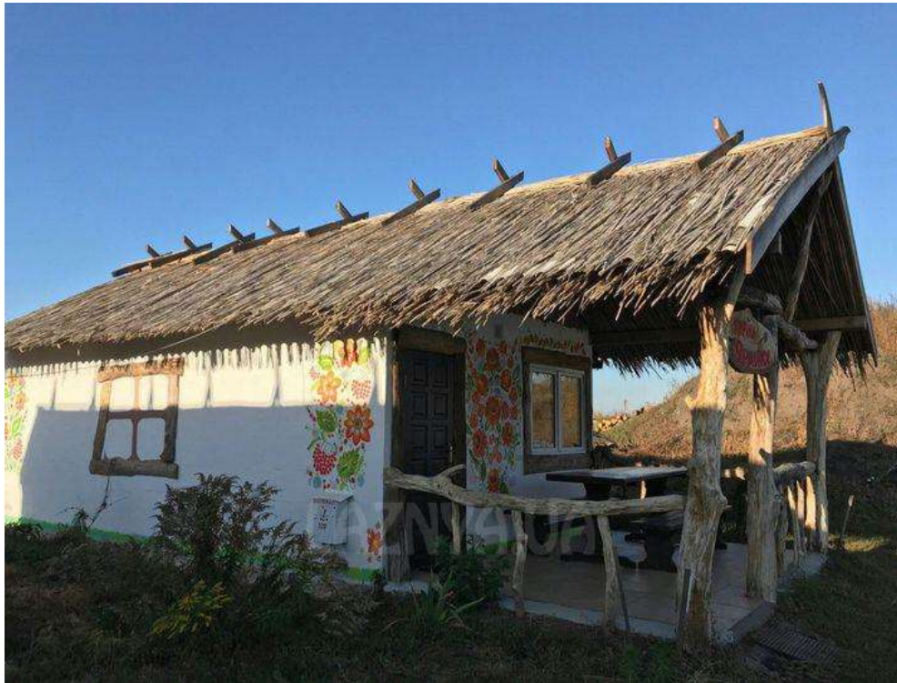
Рис. 3.10. Садиба «У Дорофея» [44]

Необхідно відзначити, що для частини об'єктів (наприклад, «Ворона», «Хутір рибацький», «Лісова казка», «Купайла») є достатньо онлайн-довідників, сторінок соціальних мереж, реєстраційних записів і каталогів для опису їхньої інфраструктури та послуг. Інша ж частина (невеликі приватні садиби, наприклад «хутір Гришівка») не має розширених офіційних інтернет-сторінок, тому для аналізу та опису доцільно отримати додаткові первинні дані: робити інформаційні запити до відповідних територіальних громад (Борзнянська, Комарівська, Талалаївська, Вертійвська), обробляти сторінки власників у Facebook та Instagram, та по можливості проводити виїзні візити і співбесіди з власниками (для підтвердження року заснування, кількості ліжок, режимів роботи та навчальних практик тощо).