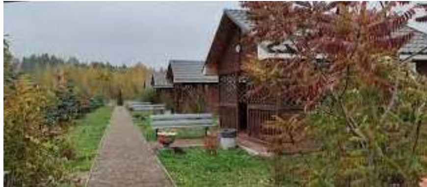
Рис. 3.9. Відпочинковий комплекс «Купайла» [30]

практикувати заходи безпеки на воді, а також вивчати економічні аспекти організації відпочинку і сезонності туристичних потоків [29, 30].