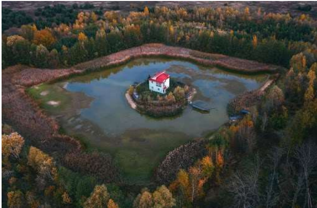
Рис. 3.4. Зооботанічний комплекс «Басань» [14]