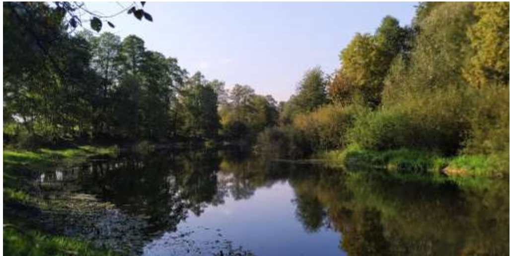
Рис. 3.6. Довкілля приватної садиби «хутір Гришівка» [47]