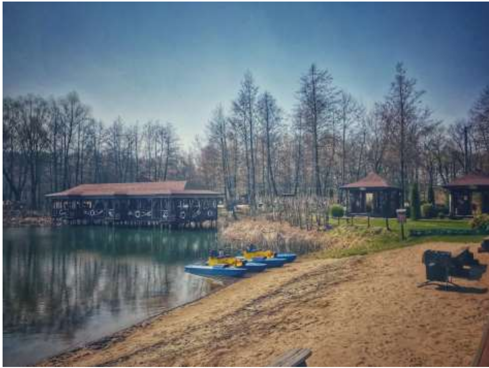
Рис. 3.7. Ресторанний комплекс «Хутір Рибачкий» [57]