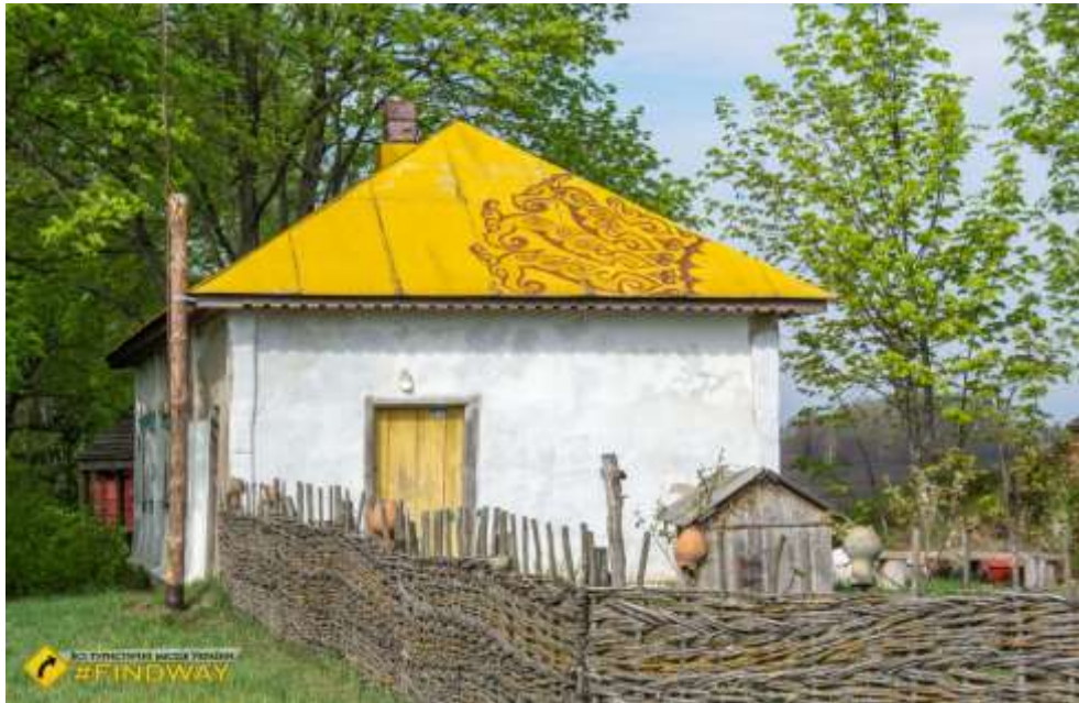
Рис. 3.3. Мистецький хутір «Острів Обирок» [42]