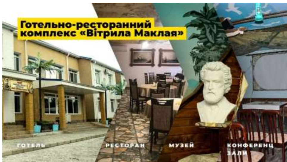
Рис. 3.1. Готельно-ресторанний комплекс «Вітрила Маклая» [21]

Комплекс «Вітрила Маклая» розташований в історичній частині Батурина, що має сильну природно-історичну складову; поєднує музейну та культурно-освітню функцію з проживанням на природі та вживанням місцевих продуктів; надає можливість відпочинку на природі, дозвілля, ознайомлення з історією, природою та культурою краю. Також «Вітрила Маклая» важливі як магніт для туристів, які хочуть поєднати екскурсійну програму (історичні пам'ятки Батурина) з проживанням в більш спокійному, рекреаційному режимі (рис. 3.1)[21].