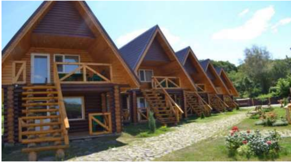
Рис. 3.2. Туристичний комплекс «Берег» [64]

відпочинок на природі) доповнюється місцевою культурою через кухню місцевості; четвертий фактор - доступність для туристів з інших міст, які шукають дозвілля і омолоджуючий відпочинок, а не міський (рис. 3.2)[64].