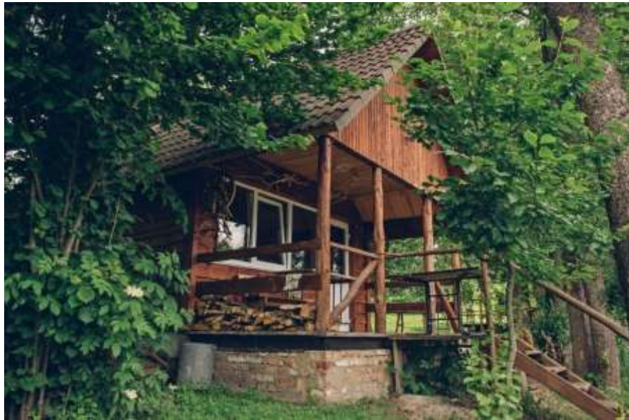
Рис. 3.5. Еко-готель на хуторі Ворона [58]