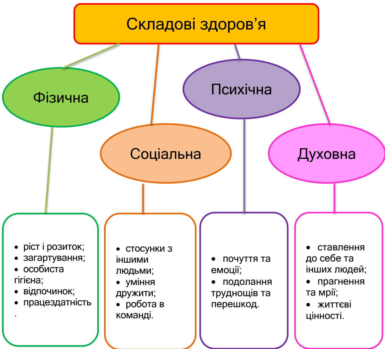
Рис. 1.1. Складові здоров'я