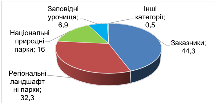
Рис. 2.1. Структура об'єктів природно-заповідного фонду Чернігівської області станом на 01.01.2024 р. (% до загальної площі ПЗФ)